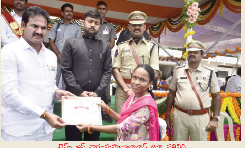
బ్రెమ్మి ఆఫ్ వార్త-మహబూబాబాద్ జిల్లా ప్రతినిధి

మహబూబాబాద్ జిల్లా దోర్నకల్ సీడీపీఓ కార్యాలయంలో వింత అప్పుడు పోస్టింగ్ ఇచ్చి డిప్యూటీషన్ పంపారు ప్రస్తుతం ఖాళీగా ఉన్న స్థానంలో పోస్టింగ్ ఇవ్వడం లేదు ప్రస్తుత స్థానంలో ప్రమోషన్ వచ్చి మరిపెడ బదిలీ అయిన ఆమెకే మళ్ళి పట్టం కట్టే ప్రయత్నం రాజకీయ కీ నీడల్లో సీడీపీఓ పోస్ట్...ఇబ్బందులు పడుతున్న క్రింద సిబ్బంది