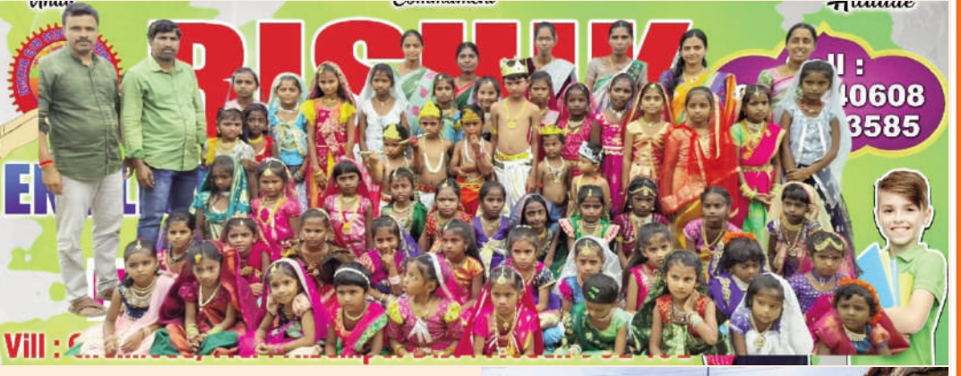
బిడ్డలను పురిల్లోనే చంపేస్తుంటారు.

టైమ్స్ ఆఫ్ వార్త మెదక్ జిల్లా ప్రతినిధి నిజాంపేట్ మెదక్ జిల్లా నిజాంపేట మండలం చల్లెడ గ్రామంలో గల రిషి ఇంగ్లీష్ మీడియం పాఠశాలలో ఈరోజు ఘనంగా శ్రీకృష్ణ జన్మాష్టమి వేడుకలు చిన్నారులతో కలిపి జరిపారు ఈ సందర్భంగా స్కూల్ యజమాన్యం మాట్లాడుతూ శ్రీకృష్ణ జన్మాష్టమి యొక్క ప్రాముఖ్యతను తెలియజేశారు. హిందూ పంచాంగం ప్రకారం, ప్రతి ఏడాది శ్రావణ మాసంలో శ్రీకృష్ణ పక్షంలో వచ్చే అష్టమి తిథి నాడు శ్రీ కృష్ణ జన్మాష్టమి వేడుకలను జరుపుకుంటారు. ఈ పవిత్రమైన రోజున ప్రపంచ వ్యాప్తంగా జన్మాష్టమి లేదా గోకులాష్టమి వేడుకలను ఎంతో ఉత్సాహంగా జరుపుకుంటారు. వేణు మాధవుడు లోకానికి దారు చూపాడు. చిన్నతనంలో కన్యయ్య అల్లరి పిల్లడుగా.. తన చిలిపి చేష్టలతో జీవిత పరమార్థాన్ని వివరించాడు. వెన్న దొంగగా మారి గోపికలతో పాటు అందరి మనసులను దోచుకున్నాడు. గోప బాలకుడిగా, సోదరునిగా, అనురంభం, ధర్మ సంరక్షకుడిగా ఎన్నో పాత్రలు పోషించాడు. కన్యయ్య ఎన్ని పాత్రలు పోషించినా అంతా లోక కళ్యాణం కోసమే. అందుకే కన్యయ్యను అందరు బాలు ఇష్టపడతారు. అందుకే కృష్ణాష్టమి వస్తోందంటే చాలు.. దేశవ్యాప్తంగా సందడి నెలకొంటుంది. ఈ పవిత్రమైన రోజున చిన్నారులను కన్యయ్య రూపంలో అలంకరించి పూజిస్తారు. ఈ ప్రతాన్ని ఆచరించి వారికి కోరికలన్నీ నెరవేరుతాయని నమ్ముతారు. ఈ నేపథ్యంలో ఈ ఏడాది కృష్ణాష్టమి ఆగస్టు 26వ తేదీ సోమవారం నాడు వచ్చింది. ఈ సందర్భంగా కృష్ణుడి గురించి.. కృష్ణాష్టమి విశిష్టత గురించి ఇప్పుడు తెలుసుకుందాం..