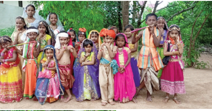
టైమ్స్ ఆఫ్ వార్త - ఎడపల్లి

శ్రీకృష్ణ జన్మాష్టమి సందర్భంగా ఎడపల్లి మండలంలోని గవర్నమెంట్, ప్రైవేటు స్కూల్లో శ్రీకృష్ణ జన్మాష్టమి వేడుకలు చేసినవారి ఘనంగా నిర్వహించారు. రాధ కృష్ణుని వేషధారణలో విద్యార్థులను అందంగా అలంకరించారు. పాఠశాలకు సోమ వారం నెలపు కావడంతో శనివారం నాడు జన్మాష్టమి వేడుకలు విద్యార్థులు, ఉపాధ్యాయులు ఆనందోత్సాహాల మధ్య జరుపుకున్నారు. పలు గ్రామాల్లోని ప్రైవేట్ స్కూల్లో అలాగే జాస్పాంపేట్ గ్రామంలోని ఇమోజ్ పబ్లిక్ స్కూల్లో ఉట్టి కొట్టే కార్యక్రమాన్ని నిర్వహించారు. శ్రీకృష్ణుని వేషధారణలో ఉన్న విద్యార్థులతో పాటు పలువురు విద్యార్థిని విద్యార్థులు ఉట్టిని కొట్టేందుకు పోటీ పడ్డారు. ఆనంతరం విద్యార్థులకు ప్రసాదాన్ని వితరణ చేశారు.