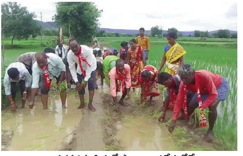
అత్యవసర పరిస్థితుల్లో ప్రాణాలు అరచేతుల్లోనే బురదలో నాట్లు వేసి నిరసన బ్రెమ్మి ఆఫ్ వార్త-మంచిర్యాల జిల్లా ప్రతినిధి