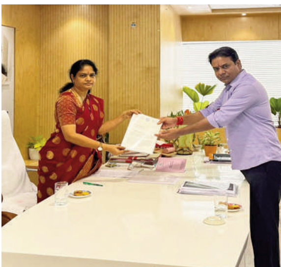
రాష్ట్రంలో మహిళలపై పెరుగుతున్న దాడులు

మహిళలంటే తనకు ఎనలేని గౌరవముందని బీఆర్ఎస్ వర్కింగ్ మెన్బెర్ కేటీఆర్ అన్నారు. ఇటీవల ఓ సమావేశంలో ఆయన చేసిన వ్యాఖ్యలకు మహిళా కమిషన్ నోటీసులు ఇచ్చిన విషయం తెలిసిందే. ఈ నేపథ్యంలో కేటీఆర్ శనివారం మహిళా కమిషన్ చైర్ వర్మన్ ను కలిసి సమాధానమిచ్చారు. మహిళా కమిషన్ కార్యాలయానికి చేరుకునేందుకు ఉదయం పది గంటలకే తెలంగాణ భవన్ కు చేరుకున్నారు. అక్కడి నుంచి 11 గంటలకు పార్టీ సీనియర్ మహిళా నేతలతో కలిసి మహిళా కమిషన్ ఎదుట హాజరై తాను చేసిన వ్యాఖ్యలపై రాత పూర్తక వివరణ ఇచ్చారు. అనంతరం మీడియాతో మాట్లాడుతూ యథాలాపంగా తాను చేసిన వ్యాఖ్యలకు ఇదివరకే క్షమాపణలు కోరానన్నారు. మహిళలన్నా, చట్టమన్నా, రాజ్యాంగబద్ధ సంస్థలన్నా తనకు గౌరవముందని, అందుకే స్వయంగా హాజరై సమాధానమిచ్చానని చెప్పారు. రాజకీయాల్లో హుందాతనం ఉండాలని, ఒక్కోసారి మాట దొర్లితే క్షమాపణ చెప్పి సంస్కారం ఉండాలన్నారు. అయితే కేటీఆర్ మహిళా కమిషన్ కార్యాలయానికి వచ్చిన సందర్భంగా కాంగ్రెస్ మహిళా నేతలు అడ్డుకునే ప్రయత్నం చేశారు. ఈ సందర్భం గా బీఆర్ఎస్, కాంగ్రెస్ మహిళా నాయకుల మధ్య తోపులాట జరిగింది. ఇలాంటి ఘటనలను కూడా కాంగ్రెస్ నాయకులు రాజకీయం చేసే ప్రయత్నం చేస్తున్నారని కేటీఆర్ ఈ సందర్భంగా విమర్శించారు.