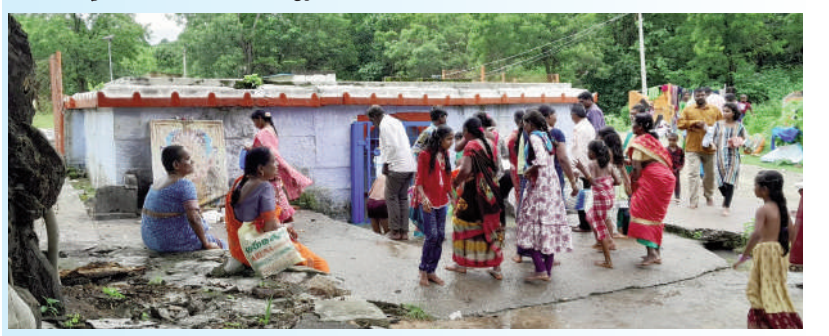
టైమ్స్ ఆఫ్ వార్త - ఎడపల్లి

దక్షిణ భారతదేశంలో ఏకైక అష్టముఖీ కొనేరుగల ప్రసిద్ధ పుణ్యక్షేత్రమైన శ్రీలక్ష్మీ నరసింహ స్వామి ఆలయానికి భక్తులు అధిక సంఖ్యలో తరలివచ్చారు. శ్రావణమాసం సందర్భంగా ఆలయం వద్దగల అష్టముఖీ కొనేరులో స్నానాలు ఆచరించి శివాలయాన్ని, శ్రీలక్ష్మీ నరసింహ స్వామి ఆలయాన్ని దర్శించుకొని ప్రత్యేక పూజలు నిర్వహించారు. అలాగే ఆలయం వద్ద పలువురు సత్సనారాయణ ప్రతాల చేపట్టారు. ఆలయం ఆధ్వర్యంలో నిర్వహించిన అన్నదాన కార్యక్రమంలో భక్తులు అన్నప్రసాదం స్వీకరించారు.