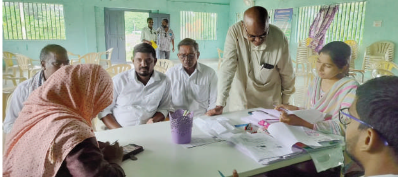
బ్రెమ్మి ఆఫ్ వార్త-మోతె