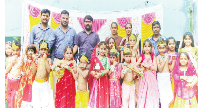
బ్రెమ్మి ఆఫ్ వార్త-మందలం