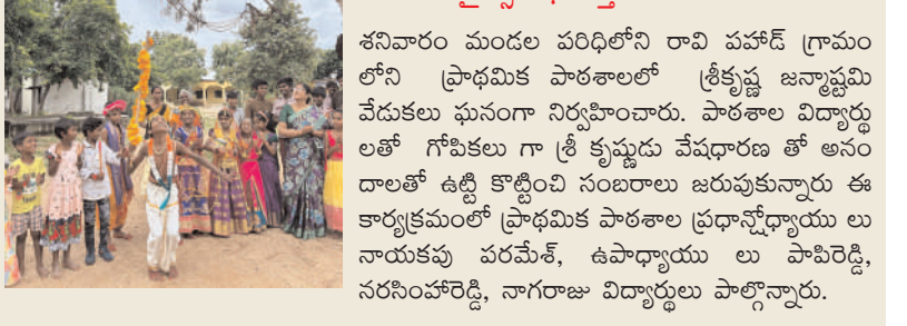
బ్రెమ్మి ఆఫ్ వార్త-కోదాడ మోతె