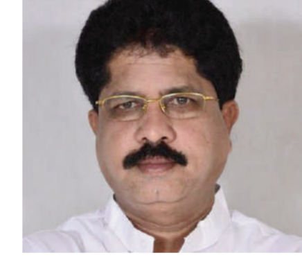
టైమ్స్ ఆఫ్ వార్త - కూకట్ పల్లి

ఎన్టీకెనా న్యాయం గెలుస్తుందన్న నమ్మకాన్ని సుప్రీం కోర్టు మరో మారు రుజువు చేసింది.. కృష్ణారావు