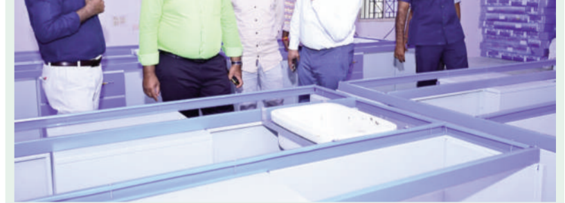
మెదక్ జిల్లా కలెక్టర్ రామూల్ రాజ్