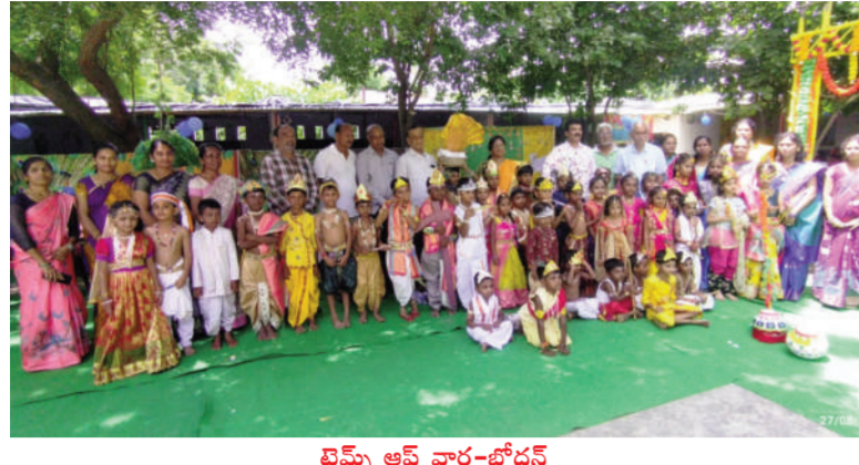
టైమ్స్ ఆఫ్ వార్త-బోధన్