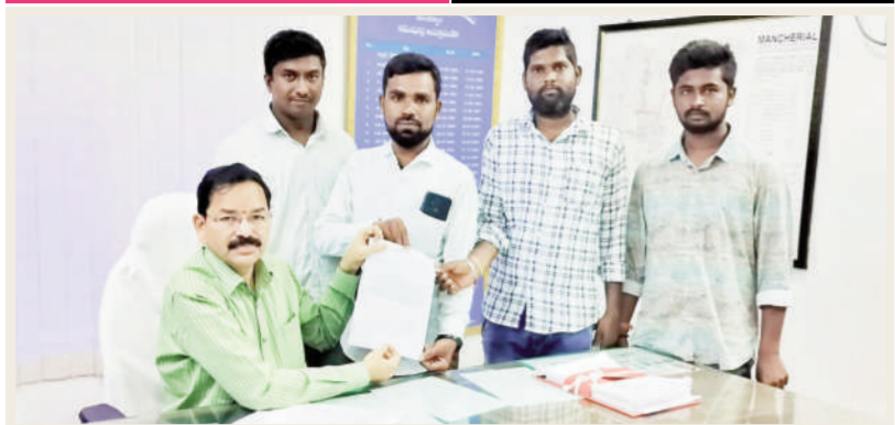
టైమ్స్ ఆఫ్ వార్డు-మంచిర్యాల జిల్లా ప్రతినిధి