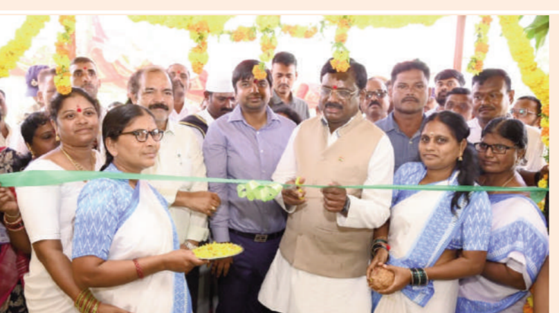
ప్రజలకు మెరుగైన వైద్యం అందించడమే ప్రభుత్వ లక్ష్యం

పదేళ్లలో నియోజకవర్గంలో ఎలాంటి అభివృద్ధి జరగలేదు