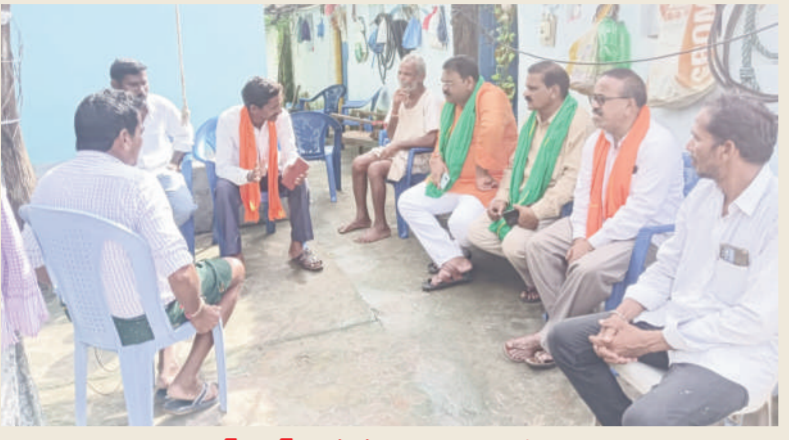
తైమ్స్ ఆఫ్ వార్డు-సంవిధ్యాల జిల్లా ప్రతినిధి