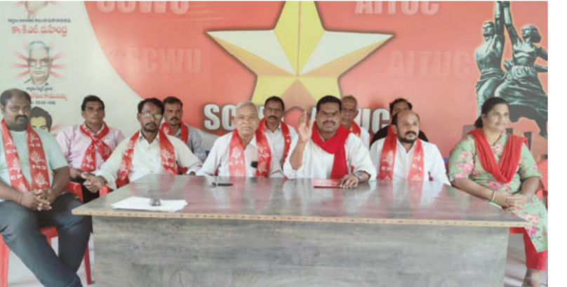
సెప్టెంబర్ 2న చలో కలెక్టరేట్ ను జయపురం చేయండి