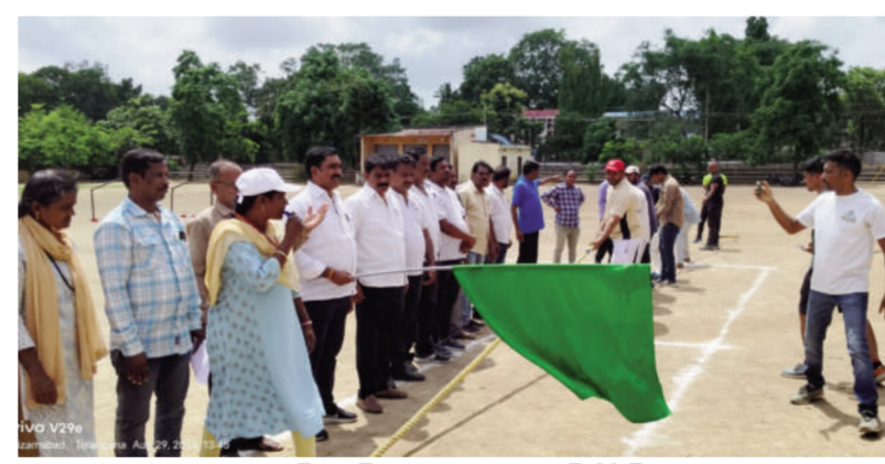
టైమ్స్ ఆఫ్ వార్త - నిజామాబాద్ సెన్ట్రల్