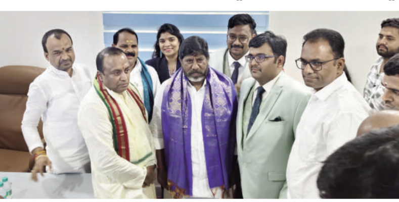
తైమ్స్ ఆఫ్ వార్డు - కూకట్ పల్లి