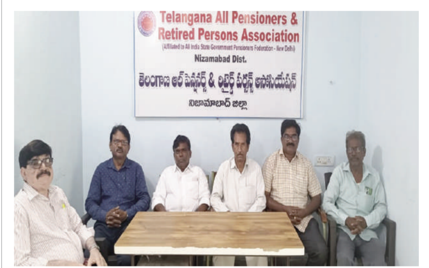
టైమ్స్ ఆఫ్ వార్త - నిజామాబాద్ సిటీ