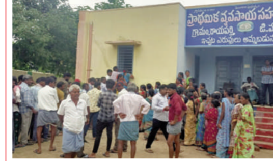
టైమ్స్ ఆఫ్ వార్త-రాయపర్తి:

పంటల సాగుకు అవసరమైన ఎరువులు విత్తనాలు అందు బాటులో ఉంచామంటూ, రైతులకు ఎలాంటి ఇబ్బందులు కలగకుండా చూస్తామంటూ సభలు, సమావేశాల్లో పాటకులు, అధికారులు ఊదరగొడుతున్నారని, వాస్తవ పరిస్థితులు అందుకు విరుద్ధంగా ఉన్నాయంటూ అన్నదాతలు ఆవేదన వ్యక్తం చేస్తున్నారు. శుక్రవారం వరంగల్ జిల్లాలోని రాయపర్తి మండల కేంద్రంలో ఎరువుల కొరతతో రైతులు నానా అవస్థలు పడుతున్నారు. ఇదే అదనుగా ఎరువుల వ్యాపారులు కృత్రిమ కొరత సృష్టిస్తూ సాము చేసుకుంటున్నారని, డీఎస్ కోనుగోలు చేస్తేనే యూరియా ఇస్తామని మెలిక పెడుతూ ఇబ్బందులకు గురి చేస్తున్నారని రైతులు ఆరోపిస్తున్నారు. ఈ-పాస్ విధానంలో సిగ్నల్స్ రావడం లేదనే సాకుతో యూరియా ను బ్లాక్ మార్కెట్ కు తరలిస్తూ, అక్రమ వ్యాపారానికి తెరలేపారు. వ్యవసాయాధికారుల పర్యవేక్షణ లోపంతో పల్లెటెజర్ దుకాణం యజమానులు యూరియా కృత్రిమ కొరతను సృష్టిస్తూ, ఇతర ప్రాంతాలకు తరలిస్తున్నారు. ప్రైవేట్ పల్లెటెజర్ దుకాణం నిర్వహిస్తున్న వ్యక్తి రెండు బస్తాల 20-20 కాంప్లెక్స్ ఎరువు కొంటేనే మూడు బస్తాల యూరియా ఇస్తానని కొరివిపెడుతున్నారు. అసలు ప్రభుత్వ నిబంధనల ప్రకారం ఒక్క యూరియా బస్తా రూ.265లకు విక్రయించాల్సి ఉంది. కానీ ప్రైవేట్ పల్లెటెజర్ నిర్వాహకులు ఎక్కువ డబ్బులు