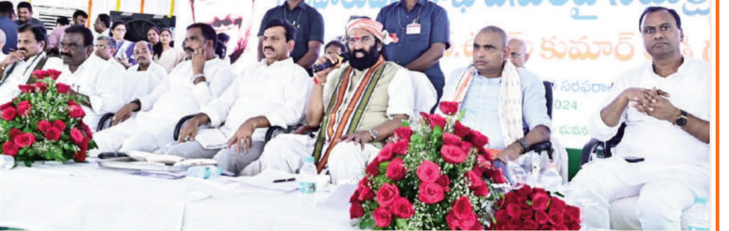
మంత్రి పొంగులేటి శ్రీనివాస్ రెడ్డి మాట్లాడుతూ..

ఇందిరమ్మ రాజ్యం వచ్చి 8 ఏమిడి నెలలు పూర్తి అయ్యాయి. 16 సంవత్సరాల క్రితం సోనియాగాంధీ శంకుస్థాపన చేసిన దేవాదులకు శుభ్రవారం ఉదయం సందర్శించామన్నారు. 2026 వార్షికోత్సవం నాటికి దేవాదుల ప్రాజెక్టును పూర్తి చేసి సోనియా గాంధీ చేతుల మీదుగా ప్రారంభించి జాతికి అంకితం చేయడం జరుగుతుందన్నారు. ఈ ప్రాజెక్టు ద్వారా దాదాపు 6 లక్షల ఎకరాలకు నీరు వస్తుంది. 31 వేల కోట్ల రూపాయలతో భూగంగా 18 వేల కోట్లు ఇప్పటి వరకే మాఫీ చేయడం జరిగిందని, మిగతా 13 వేల కోట్ల రూపాయలు కూడా త్వరగా మాఫీ చేస్తామని, అవసరమైతే ఇంకా 500 కోట్లు ఎక్కువైనా ఇస్తామని వివరించారు.. గడిచిన ఉమ్మడి రాష్ట్రంలో 18 లక్షల 50 వేల ఇందిరమ్మ ఇండ్లు కట్టించడం జరిగిందని, రోజువారీ 45 రోజులలోపై రాష్ట్రంలో ఇందిరమ్మ ఇండ్లకు నిర్మాణానికి ముగిసేయడం జరుగుతుందని తెలిపారు. ఈ ప్రభుత్వం మీద, ప్రజల కోరికలను మన ముఖ్యమంత్రి నాయకత్వంలో పూర్తి చేస్తామని అన్నారు. ధరణి ప్రక్షాళన చేస్తామని, ల్యాండ్ రెవెన్యూ చట్టాన్ని దేశంలోనే రోల్ మోడల్ గా చేస్తామన్నారు.