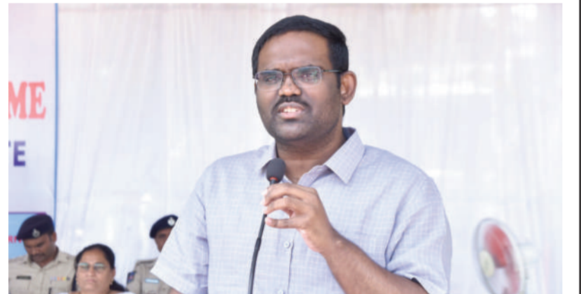
టైమ్స్ ఆఫ్ వార్త - నిజామాబాద్ కలెక్టరేట్