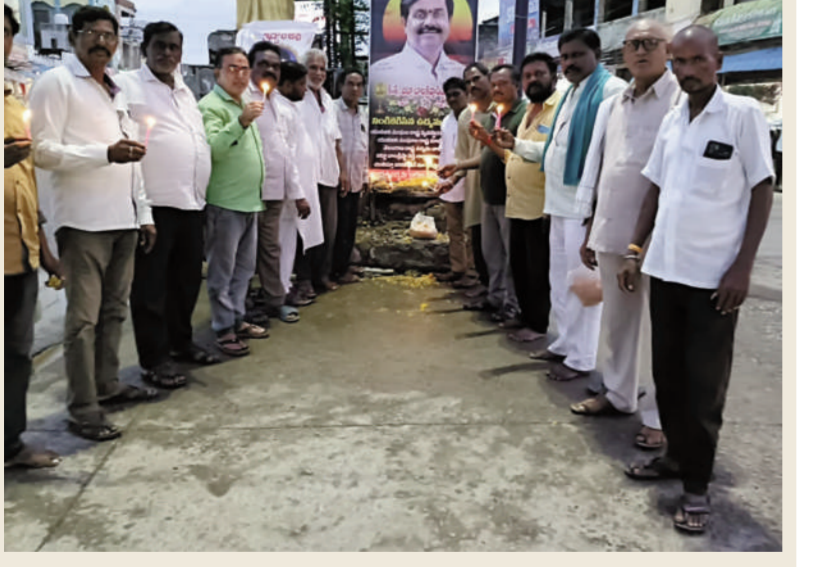
మలిదశ తెలంగాణ ఉద్యమకారుల పోరం ప్రతినిధులు