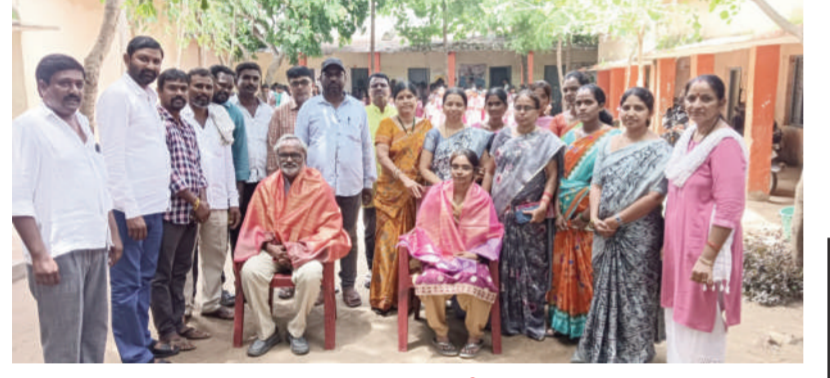
టైమ్స్ ఆఫ్ వార్త-బోధన్