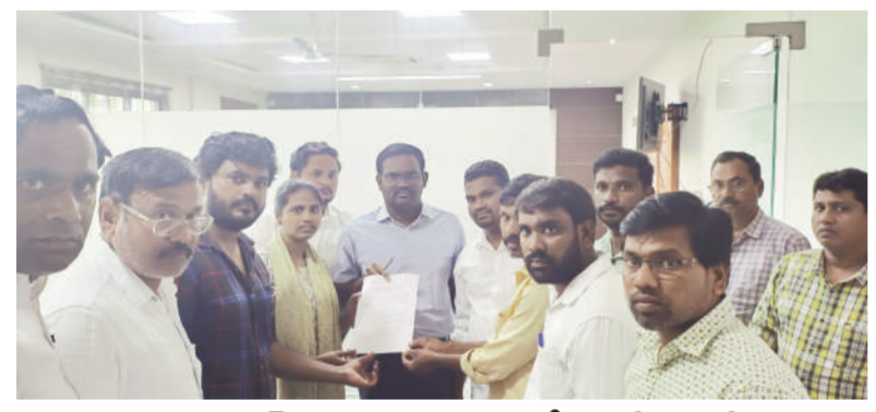
జిల్లా కలెక్టర్ కు వినతి పత్రం అందజేసిన రక్షిత తండ్రి