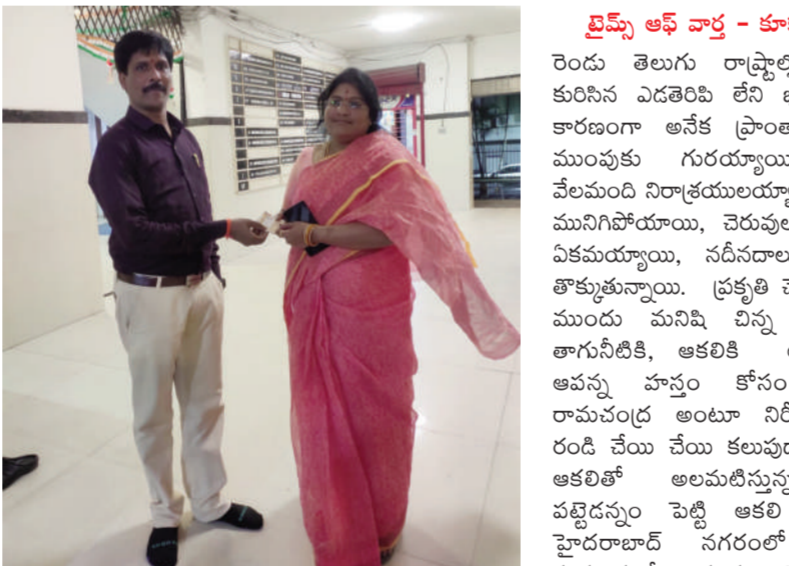
అమ్మని ఫౌండేషన్ ఛైర్ పర్సన్, అమ్మని ములుగు ఐదు రోజుల సేవా కార్యక్రమాలను... దాతల సాయం కీలకమైనది... అమ్మని ఫౌండేషన్