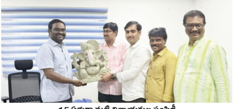
15 ఏళ్లుగా మట్టి వినాయకుల పంపిణీ టైమ్స్ ఆఫ్ వార్త - నిజామాబాద్ సీట్

పర్యావరణ పరిరక్షణ కోసం నిజామాబాద్ జిల్లా రెవెన్యూ ఉద్యోగులు తమదైన శైలిలో ఎంతో కృషి చేస్తున్నారు. గత పదిహేను ఏళ్లుగా మట్టి వినాయకులను జిల్లాకు తెప్పించి పంపిణీ చేస్తున్నారు. పీ వో పీ వినాయకులు, రంగు రంగుల వినాయకులను మత్తమే ఎంపిక చేసిన తరుణంలో మట్టి వినాయకులను కూడా రంగు రంగులుగా ఎంతో అందంగా ఉన్నావని తెలియజేస్తూ తమ వంటగా మట్టి వినాయకుల ద్వారా ప్రజలను జాగ్రత్తం చేసింది వీరే.