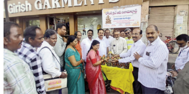
రోటరీ క్లబ్ ఆధ్వర్యంలో మట్టి వినాయకుల పంపిణీ