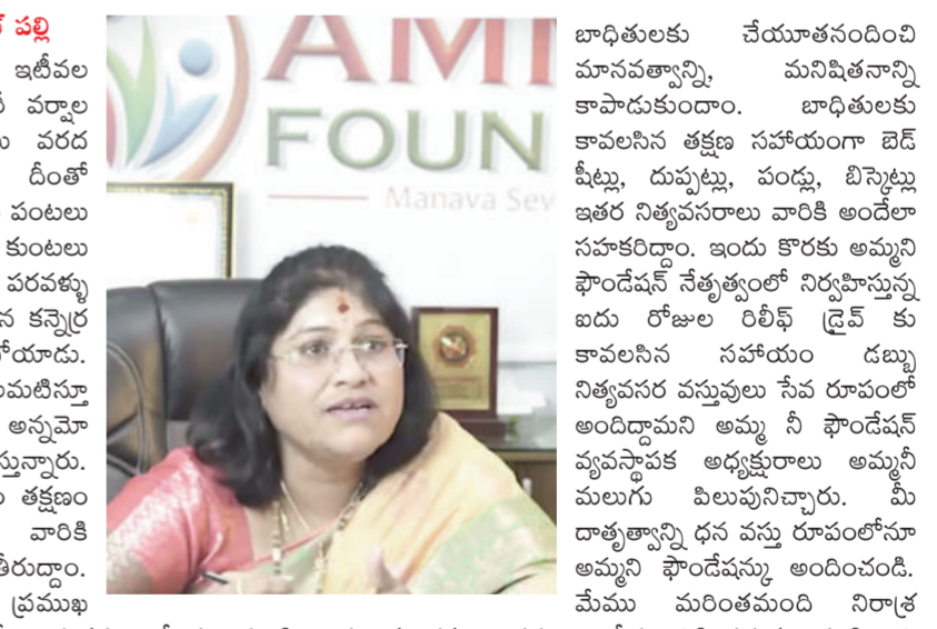
అమ్మని ఫౌండేషన్ ఛైర్ పర్సన్, అమ్మని ములుగు ఐదు రోజుల సేవా కార్యక్రమాలను... దాతల సాయం కీలకమైనది... అమ్మని ఫౌండేషన్