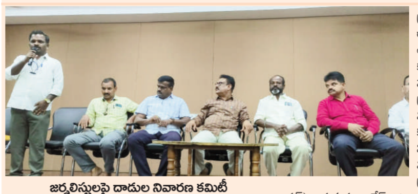
జర్నలిస్టులపై దాడుల నివారణ కమిటీ