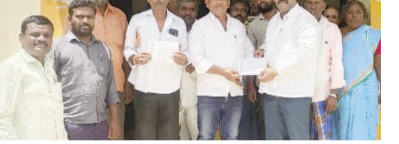
22 మందికి కొత్తరుణాలు