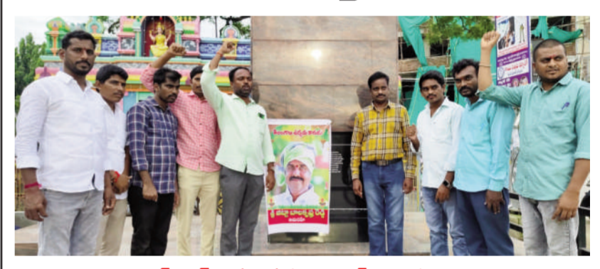
టైమ్స్ ఆఫ్ వార్త - మహబూబాబాద్ జిల్లా ప్రతినిధి