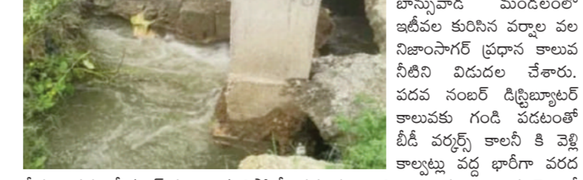
టైమ్స్ ఆఫ్ వార్త - బాన్సువాడ

బాన్సువాడ మండలంలో ఇటీవల కురిసిన వర్షాల వల నిజాంసాగర్ ప్రధాన కాలువ నీటిని విడుదల చేశారు. పదవ నంబర్ డిస్ట్రిబ్యూటర్ కాలువకు గండి పడటంతో వీడి వర్షాల్ని కాలనీ కి వెళ్లి కాల్వల్ని వద్ద భారీగా వరద నీరు రావడంతో కల్వర్ల పూర్తిగా కూలిపోయే ప్రమాదం ఉంది. అధికారులు కాల్వను వెంటనే మరమ్మత్తు చేయించాలని కానీవాసులు కోరుతున్నారు. లేనియెడల భవిష్యత్తులో భారీ ప్రమాదం చోటుచేసుకునే అవకాశం ఉంటుంది.