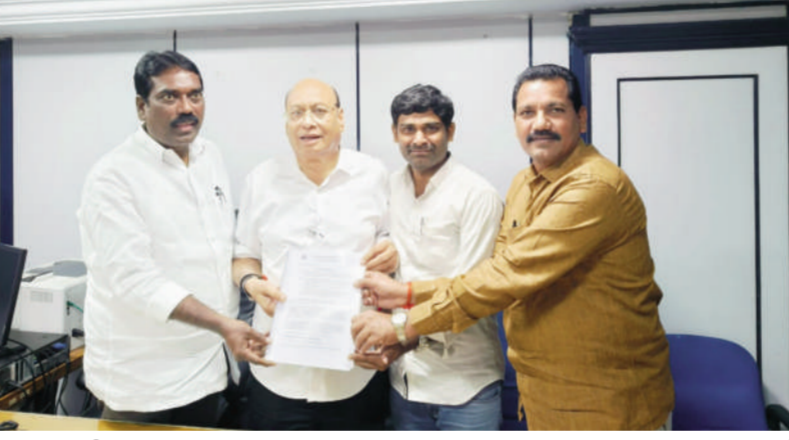
సింగరేణి ప్రాతినిధ్య హోదా పత్రాన్ని అందుకున్న ఏఐటియుసి