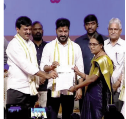
తైమ్స్ ఆఫ్ వార్త-పిట్లం