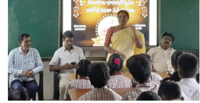
టైమ్స్ ఆఫ్ వార్త - నిజామాబాద్ విద్యావిభాగం