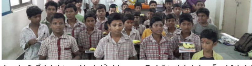
టైమ్స్ ఆఫ్ వార్త - ఎడపల్లి