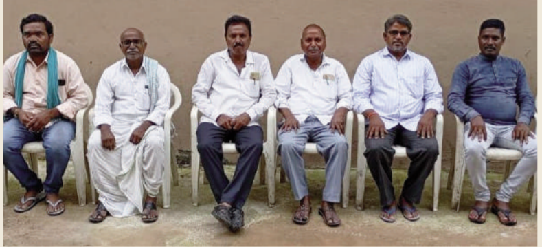
టైమ్స్ ఆఫ్ వార్త - నిజామాబాద్ సీట్