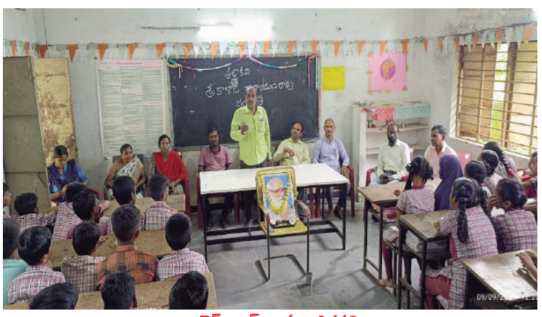
టైమ్స్ ఆఫ్ వార్త - ఎడపల్లి

తెలంగాణా కవి కాళోజి నారాయణరావు జయంతి సందర్భంగా ఎడపల్లి మండల కేంద్రంలోని తహసీల్దార్ కార్యాలయంలో రెవెన్యూ సిబ్బంది కాళోజి చిత్రపటానికి పూలమాలలు వేసి ఘనంగా నివాళులు అర్పించారు. అలాగే మండలంలోని ఆయా గ్రామాల్లోని గవర్నమెంట్, ప్రైవేట్ స్కూళ్లలో టీచర్లు, స్టూడెంట్స్ కాళోజి నారాయణ రావు చిత్రపటానికి పూలమాలలు వేసి