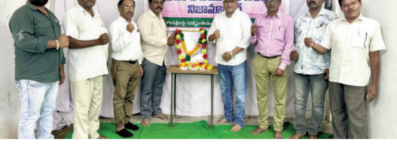
టైమ్స్ ఆఫ్ వార్త - నిజామాబాద్ కల్చర్