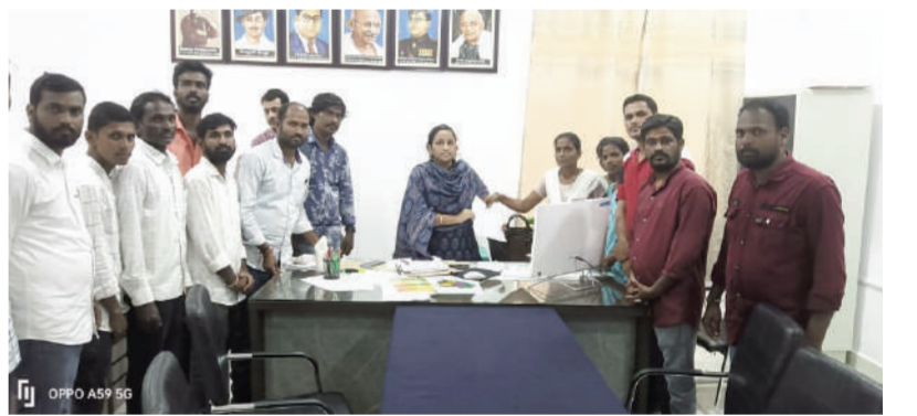
టైమ్స్ ఆఫ్ వార్త - బాన్సువాడ