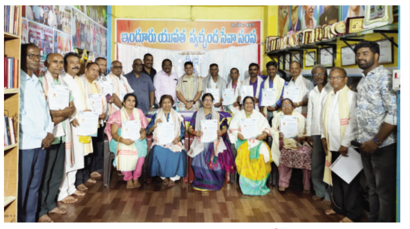
టైమ్స్ ఆఫ్ వార్త - నిజామాబాద్ సీట్