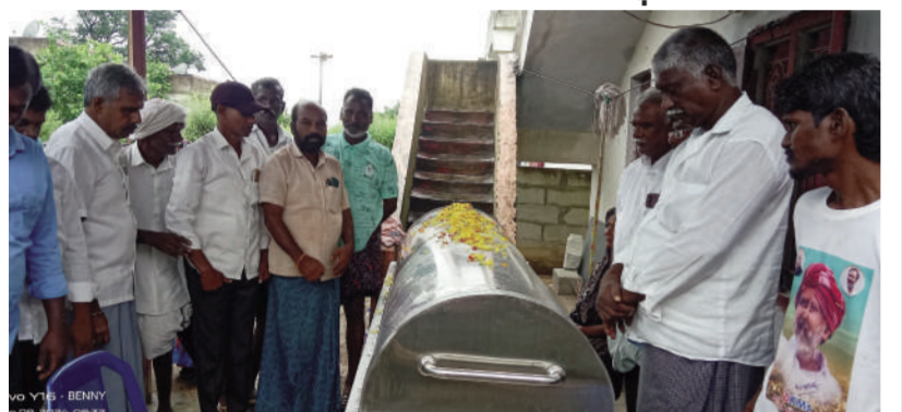
టైమ్స్ ఆఫ్ వార్త-చింతకాని