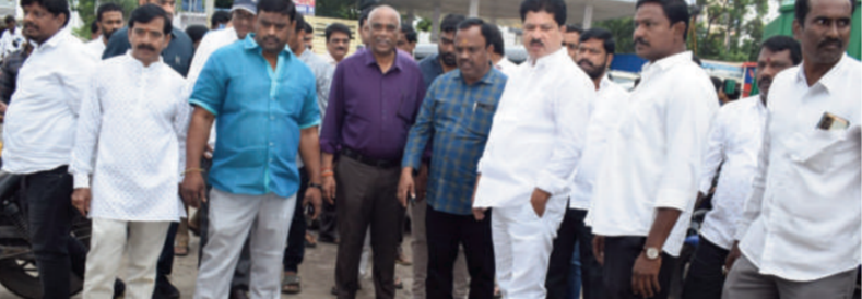
తైమ్స్ ఆఫ్ వార్త - కూకట్ పల్లి