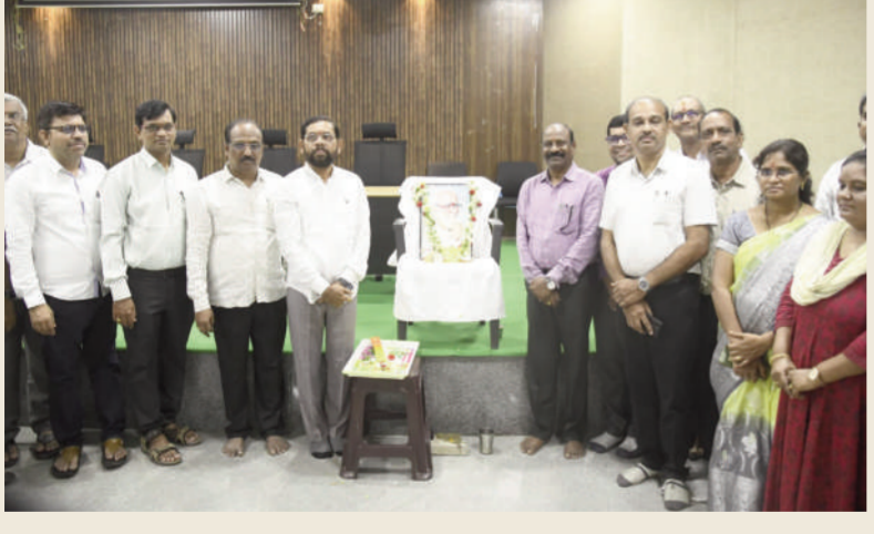
టైమ్స్ ఆఫ్ వార్త - మంచిర్యాల జిల్లా ప్రతినిధి