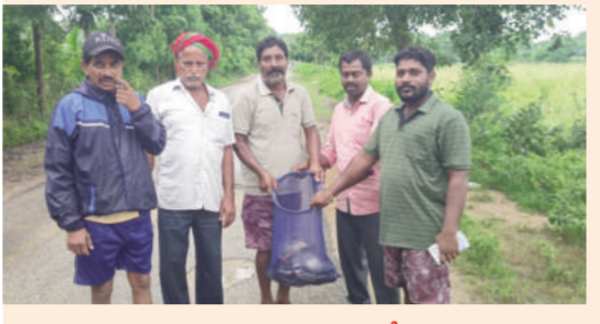
తైమ్స్ ఆఫ్ వార్త-వర్ధన్నపేట