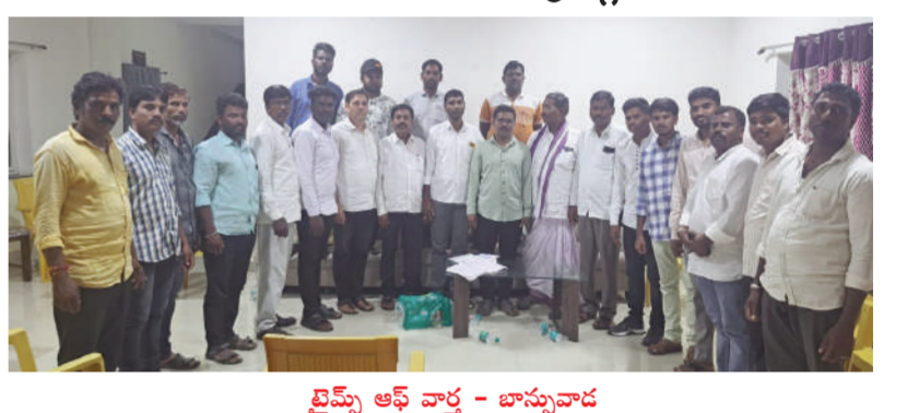
టైమ్స్ ఆఫ్ వార్త - బాన్సువాడ