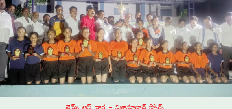
టైమ్స్ ఆఫ్ వార్త - నిజామాబాద్ స్పోర్ట్స్