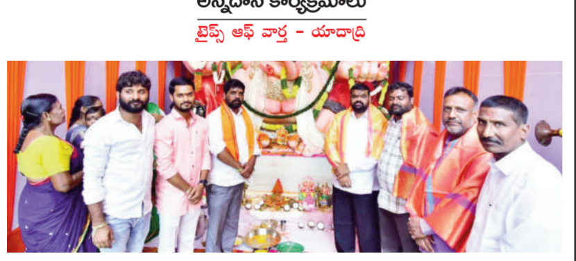
అన్నదాన కార్యక్రమాల తైమ్స్ ఆఫ్ వార్త - యాదాద్రి