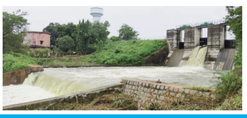
టైమ్స్ ఆఫ్ వార్త - ఎడపల్లి