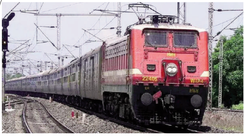
అక్టోబర్ 21 నుంచి నడువనున్నట్లు ప్రకటించిన ఎన్సీఆర్ హైదరాబాద్

దసరా, దీపావళి, ఛత్ర పండుగల సేపట్లలో దక్షిణ మధ్య రైల్వే జోన్ అధ్యక్షులతో 48 ప్రత్యేక రైళ్లను నడుపనున్నట్లు అధికారులు బుధవారం తెలిపారు. అక్టోబర్ 21 నుంచి నవంబర్ 13 వరకు ప్రత్యేక రైళ్లు అందుబాటులో ఉంటాయని పేర్కొన్నారు. నాందేడ్-పన్నేల్ మధ్య 24, కొమవెల్లి-నిజాముద్దీన్ మధ్య 16, పుణె-కరీంనగర్ మధ్య 8 సర్వీసులను ఏర్పాటు చేశారు. అలాగే గోరఖపూర్-మహాబాబానగర్ రైల్వే స్టేషన్ల మధ్య రెండు ప్రత్యేక సర్వీసులు పొడిగించినట్లు అధికారులు ప్రకటించారు. ఈ నెల 21, 22 తేదీల్లో సర్వీసులు నడుస్తాయని పేర్కొన్నారు.