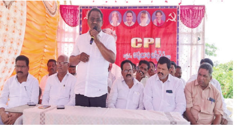
టైమ్స్ ఆఫ్ వార్త - చింతకాని