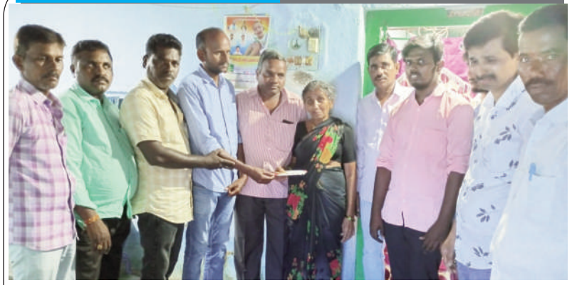
టైమ్స్ ఆఫ్ వార్త-మహాబాబాద్ జిల్లా ప్రతినిధి