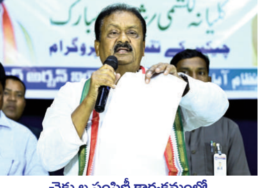
చెక్కుల పంపిణీ కార్యక్రమంలో మంత్రి జూపల్లి కృష్ణారావు రాజీవ్ గాంధీ ఆడిటోరియం ఆధునికీకరణకు రూ.50 లక్షల మంజూరు