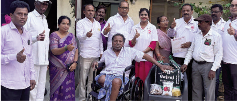
టైమ్స్ ఆఫ్ వార్త - కాకట్ పల్లి

పేదలకు సహాయం చేస్తున్న హెల్ప్ హాండ్ చాలిబబుల్ ట్రస్ట్ సంస్థ అభినందనీయం..