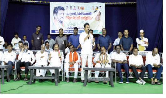
గత ప్రభుత్వ బాధ్యతారాహిత్య పాలనతో 8 లక్షల కోట్ల అప్పుల ఊబలో కురుకుపోయింది