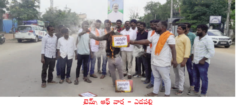
టైమ్స్ ఆఫ్ వార్త - ఎడపల్లి సికింద్రాబాద్ శ్రీ ముత్యాలమ్మ ఆలయం విధ్వంసం, శాంతియుతంగా నిరసన వ్యక్తం చేస్తున్న హిందువులపై పోలీసులు జరిపిన లాఠీచార్జిని ఖండిస్తూ సోమవారం ఎడపల్లి మండల కేంద్రంలో బిజెపి, విశ్వహిందూ పరిషత్, బజరంగ్ దళ్, హిందూవాహిని అధ్వర్యంలో సంఘవిప్రోహం