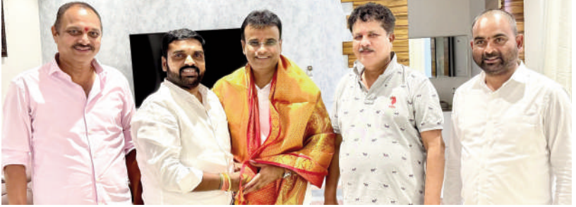
టైమ్స్ ఆఫ్ వార్త - కాకట్ పల్లి