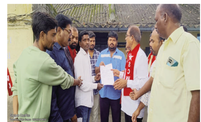
టైమ్స్ ఆఫ్ వార్త-మండపల్లి