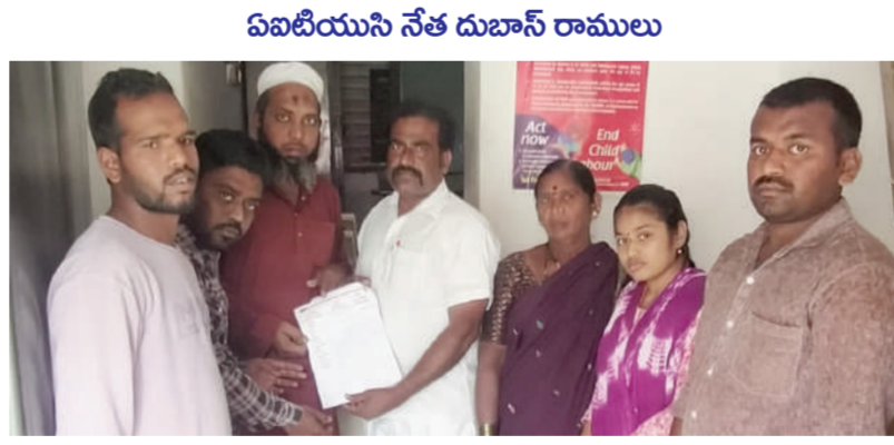
టైమ్స్ ఆఫ్ వాంద్రా - బాన్సువాడ