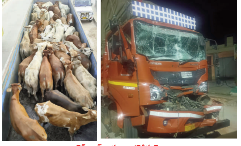
వైమ్మి ఆఫ్ వార్త - జాజిరెడ్డిగూడెం

డ్రైవర్ కు గాయాలు వాహనంలో ఉన్న గోవులని గోశాలకు తరలింపు