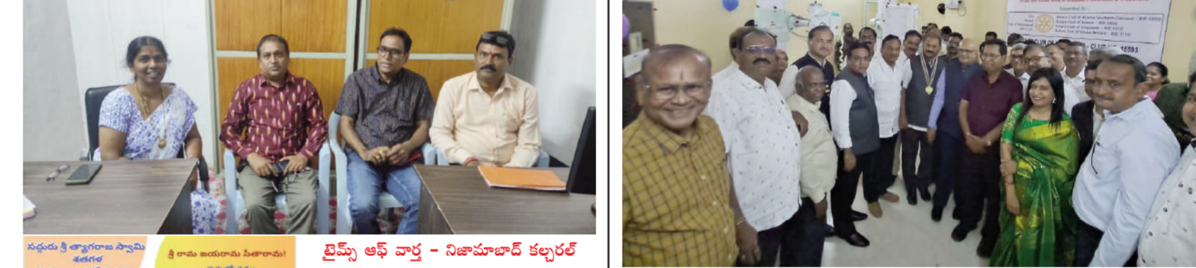
తైమ్స్ ఆఫ్ వార్త - నిజామాబాద్ కల్చరల్