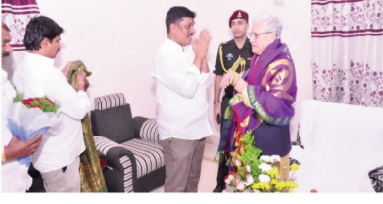
టైమ్స్ ఆఫ్ వాంద్రా-భువనగిరి