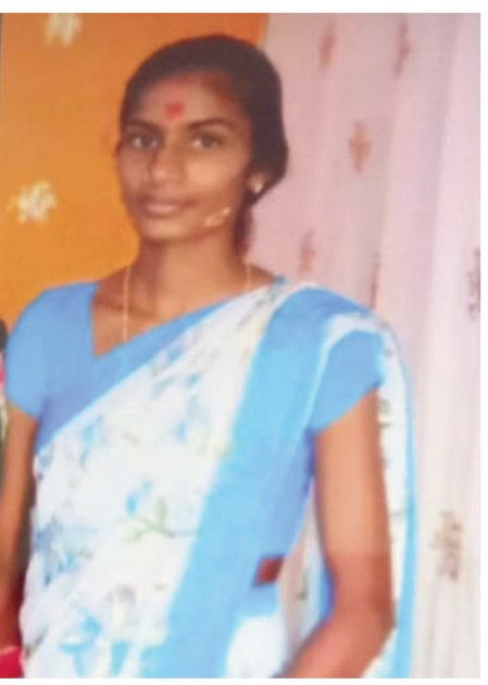
టైమ్స్ ఆఫ్ వాంద్రా - ఎడపల్లి