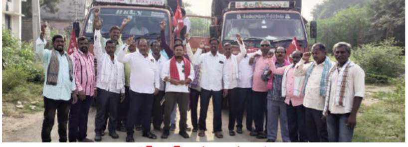
వైమ్మి ఆఫ్ వార్త - బాన్సువాడ: