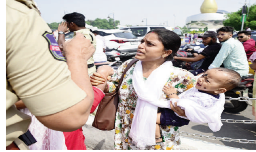
చేస్తున్నారని ఆవేదన వ్యక్తం చేశారు. ఈ క్రమంలోనే నెలపులు రద్దుచేస్తూ గతంలో జారీ చేసిన ఆదేశాలను పోలీస్ శాఖ తాత్కాలికంగా నిలిపివేస్తూ ఉత్తర్వులు జారీ చేసింది. తదుపరి ఆదేశాలు ఇచ్చే వరకు ఈ ఉత్తర్వులు అమల్లో ఉంటాయని పేర్కొంది. ఈ అంశంపై కానిస్టేబుళ్ల కుటుంబ సభ్యులతో చర్చించాలని నిర్ణయించింది.

సచివాలయం ముట్టడి ఉదయం 11 గంటలకు ప్రారంభమైంది. తెలుగు తల్లి ఫైబర్ కింద నుంచి అమరవీరుల స్మారక కేంద్రం పక్క నుంచి కానిస్టేబుళ్ల భార్యలు సచివాలయం ముట్టడి కోసం పరిగెత్తుకుంటూ వచ్చారు. దీంతో ఆళ్లరుపోవడం పోలీసుల వంతుంది. కాగా వచ్చిరాగానే వారందరిని పోలీసులు అరెస్ట్ చేయడం ప్రారంభించారు. దీంతో సచివాలయం ప్రధాన రహదారిలో కొంతసేపు ట్రాఫిక్ ప్రంభించింది. టీజీఎన్టీ హాజూ, ఏక్ పోలీస్ బనావో అంటూ అందోళనకు దిగిన కానిస్టేబుళ్ల భార్యల డిమాండ్కు తలొగ్గిన పోలీస్ శాఖ, యుద్ధప్రాతినిధులకు పరిశీలించి పాత విధానాన్ని కొనసాగిస్తామని ప్రకటించడం గమనార్హం. ఒకే దగ్గర దుబ్బీ చేసేలా చర్యలు తీసుకోవాలని, ఇక్కడ అక్కడ అంటూ వేధిస్తున్నారని ఈసందర్భంగా వారు డిమాండ్ చేశారు. తమిళనాడు, కర్ణాటక రాష్ట్రంలో ఉన్న విధానాన్ని అమలు చేయాలని విజ్ఞప్తి చేశారు. ఆయా ప్రాంతాల్లో గత రెండు రోజులూ వీరు ఆందోళన చేపడుతుండటం, శుక్రవారం విషయం తెలిసినట్లే. ఎన్డీఆర్ స్టేడియం దగ్గర ఈ ఆందోళన చేపట్టారు. ముట్టడి నేపథ్యంలో సచివాలయ ప్రాంగణంలో ఉద్రిక్తత నెలకొంది. ఆందోళన చేస్తున్న వారిని అదుపులోకి తీసుకోవడానికి పోలీసులు తీవ్రంగా శ్రమించాల్సి వచ్చింది. వచ్చింది మహిళలు, పిల్లల కావడం , అందుగా తమ పోలీసుల కుటుంబాలతో కావడంతో ఇబ్బందులు తప్పలేదు. వారందరిని బందోబస్తులో ఉన్న పోలీసులు అడ్డుకునే సందర్భంగా. తమ భర్తలతో పోలీసు విధులు కాకుండా కూలి పనులు చేయమన్నారని కుటుంబసభ్యులు ఆలోచించడం గమనార్హం. పోలీసు విధులకు, వాళ్లు చేస్తున్న పనికి సంబంధం లేదనీ, పండుగలకు కూడా ఇంటికి రాకుండా