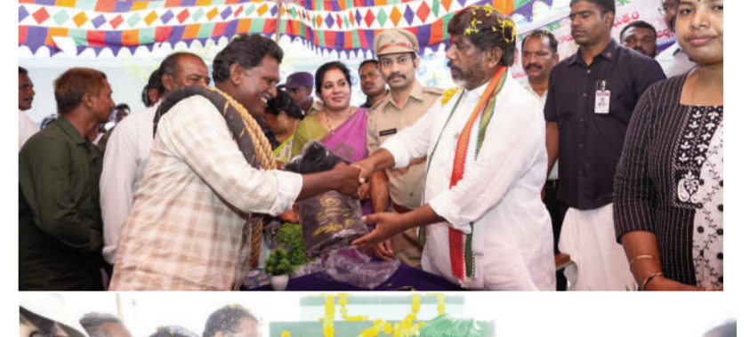
తీసుకొని కాటమయ్య రక్షణ కవచాలను పంపిణీ చేస్తున్నట్లు తెలిపారు. గత ప్రభుత్వం వృద్ధులకు సమస్యలను పట్టించుకోలేదని వారికి కావలసిన సౌకర్యాలను కూడా అందించడంలో విఫలం చెందిందన్నారు. భవిష్యత్తులో కల్లుగీత కార్మికుల భద్రత కోసం హాతూట్ల కవచం కిట్లు మెరుగైనవి వస్తే వాటిని కూడా పంపిణీ చేయడానికి ప్రభుత్వం సిద్ధంగా ఉందన్నారు. ప్రజా సంక్షేమమే పరమావధిగా ప్రజా ప్రభుత్వం పనిచేస్తున్న విషయాన్ని ప్రజలు గుర్తించాలని కోరారు. చేప పిల్లల పంపిణీలో అవకతవకలు పాల్పడితే చర్యలు తప్పవు రాష్ట్ర ప్రభుత్వం 100% రాయితీతో ఇస్తున్న చేప పిల్లల పంపిణీలో అవకతవకలు జరిగితే సహించేది లేదని హాతూట్ల సీఎం భట్టి విక్రమార్కు హెచ్చరించారు. గత ప్రభుత్వంలో మాదిరిగా చేప పిల్లల పంపిణీ, చేపల పెంపకంపై అవినీతి ఆరోపణలు వస్తే అధికారులపై చర్యలు ఉంటాయన్నారు. మత్స్య సహకార సంఘాలకు నాణ్యత కలిగిన చేప పిల్లలు పంపిన అయ్యేలా చూడాలని అధికారులను ఆదేశించారు. ఈ కార్యక్రమంలో, కాంగ్రెస్ పార్టీ మండల అధ్యక్షులు గారి దుర్గారావు, డిసినీ సభ్యులు పైడిపల్లి కిషోర్, మాజీ జెడ్పీసీ సుధీర్ బాబు, కాంగ్రెస్ పార్టీ ముఖ్య నాయకులు కార్యకర్తలు పాల్గొన్నారు.

తైమ్స్ ఆఫ్ వార్త - బోసకల్ ఇందిరమ్మ రాజ్యంలో ఏర్పడిన ప్రజా ప్రభుత్వం రాష్ట్రంలోని ప్రతి ఒక్కరి క్షేమం, సంక్షేమం గురించి ఆలోచిస్తుందని రాష్ట్ర ఉప ముఖ్యమంత్రి భట్టి విక్రమార్కు మల్లు అన్నారు. ఆదివారం ఖమ్మం జిల్లా మధ్య నియోజకవర్గం బోసకల్ మండలం తూటికుట్ల గ్రామంలో రూ.3 కోట్ల 95 లక్షలతో హాతూటికుట్ల నుంచి గోవిందాపురం ఎలెక్ట్రోగ్రామానికి, బ్రాహ్మణపల్లి గ్రామంలో రూ. 2 కోట్ల 45 లక్షలతో బ్రాహ్మణపల్లి నుంచి రావల్లి గ్రామానికి, కలకొట గ్రామంలో 1.50 కోట్ల రూపాయలతో కలకొట నుంచి హానారాయణపురం, అల్లపాడు నుంచి నారాయణపురం, చిరునోముల గ్రామంలో రూ. 3.50 కోట్ల రూపాయలతో చిరునోముల నుంచి దర్శాకుపల్లి గ్రామాలకు బిటిహోడ్డు నిర్మాణ పనులకు బీటీ రోడ్డు సీఎం భట్టి విక్రమార్కు శంకుస్థాపన చేశారు. అదేవిధంగా కలకొట గ్రామంలోని జిల్లా పరిషత్ ఉన్నత పాఠశాలలో బీసీ సంక్షేమ శాఖ-ఎక్సైజ్ శాఖ సంయుక్త ఆధ్వర్యంలో ఏర్పాటు చేసిన కార్యక్రమంలో కల్లుగీత కార్మికులకు కాటమయ్య రక్షణ కవచం కిట్లను డిప్యూటీ సీఎం పంపిణీ చేశారు. ఆ తర్వాత కలకొట పెద్ద చెరువులో చేపల పెంపకం కోసం ప్రభుత్వం 100% రాయితీపై ఇచ్చిన చేప పిల్లలను మత్స్య సహకార సంఘం సాసైలీ సభ్యులకు బీటీ రోడ్డు సీఎం భట్టి విక్రమార్కు అందజేశారు. ఈ సందర్భంగా ఆయా గ్రామాల్లో ఏర్పాటు చేసిన కార్యక్రమంలో ప్రజలను ఉద్దేశించి డిప్యూటీ సీఎం భట్టి విక్రమార్కు మాట్లాడారు. కల్లుగీత కార్మికుల భద్రత, ఆరోగ్యం, క్షేమం అన్నింటినీ పరిగణలోకి