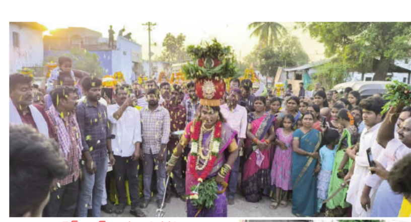
టైమ్స్ ఆఫ్ వార్త - ఎడపల్లి