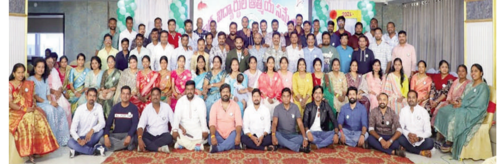
టైమ్స్ ఆఫ్ వార్త - నిజామాబాద్ సిటీ

నిజామాబాద్ నగరంలోని పద్మా నగర్ లో గల వివేకానంద విద్యాలయ పూర్వ విద్యార్థుల ఆత్మీయ సమ్మేళనాన్ని ఘనంగా జరుపుకున్నారు. 2003 - 04 విద్యా సంవత్సరంలో 10వ తరగతి పూర్తి చేసుకున్న విద్యార్థులు 20 సంవత్సరాల తర్వాత మళ్ళీ ఈ విధంగా కలుసుకొని తమ అనుభవాలను పంచుకునేందుకు బైపాస్ రోడ్డులోని లహరి హోటల్ వేదికయింది. ఆ సంవత్సరం వివేకానంద పాఠశాలలో సుమారు 120 మంది విద్యార్థులు మూడు సెక్షన్ లలో విద్యను అభ్యసించగా అందులో నుంచి సుమారు 85 మందికి పైగా ఈ సమ్మేళనంలో పాల్గొనడం విశేషం. అంతేకాకుండా సుమారు 30 మంది విద్యార్థిని ఇందులో పాల్గొన్న వారు ఉండగా అందులో నుంచి 15 మంది హైదరాబాద్, ముంబై ప్రాంతాల నుంచి నేరుగా హాజరయ్యారు. దీంతో గత నెల రోజులుగా చేసిన వీరి కృషికి ఫలితం దక్కింది. 20 సంవత్సరాల క్రితం ఒకే