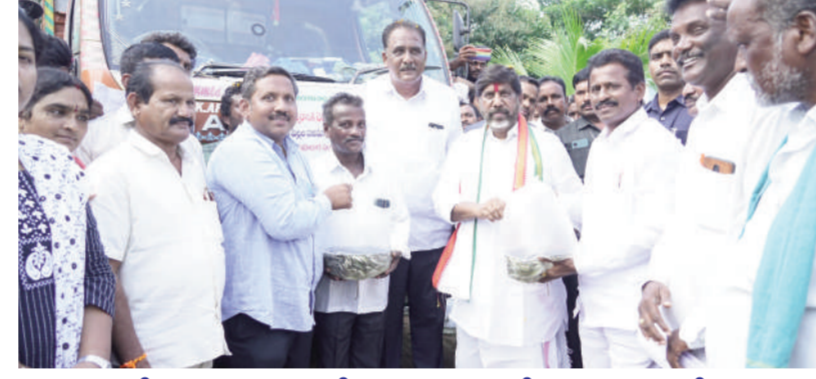
బోసకల్ మండలంలోని పలు గ్రామాల్లో రూ.11.10 కోట్ల

బీటీ రోడ్డు పనులకు శంకుస్థాపన కలకొట లో కల్లుగీత కార్మికులకు కాటమయ్య రక్షణ కవచాల కిట్ల పంపిణీ చేపట్టిన పంపిణీలో అవకతవకలు జరిగితే చర్యలు తప్పవు రాష్ట్ర ఉప ముఖ్యమంత్రి భట్టి విక్రమార్కు