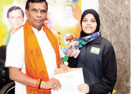
తైమ్స్ ఆఫ్ వార్త - నిజామాబాద్ సోన్సెట్