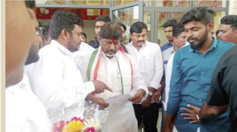
తైమ్స్ ఆఫ్ వార్త - చింతకాని