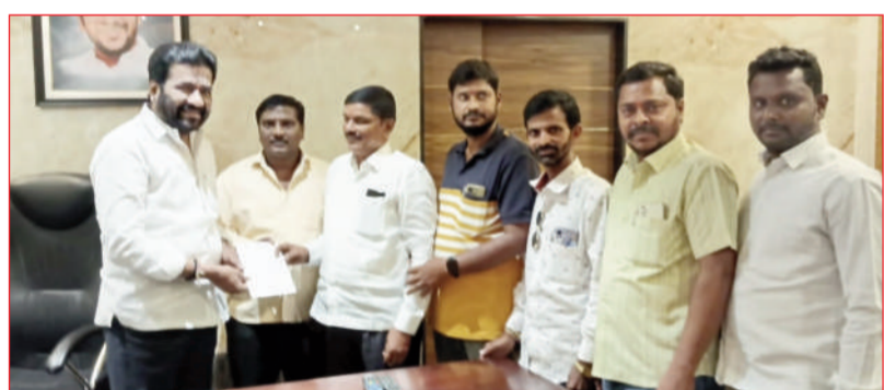
అతిథులకు ఆహ్వాన పత్రాలు అందజేసిన కమిటీ సభ్యులు