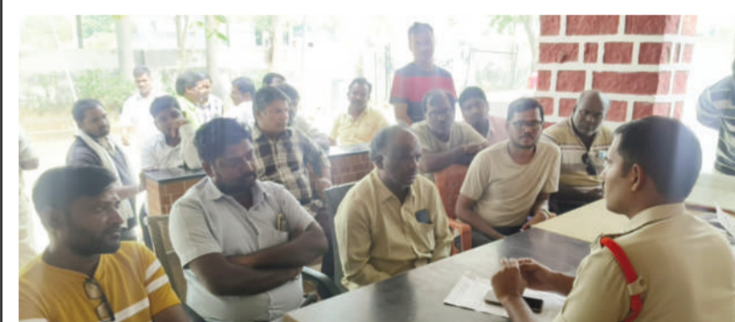
తైమ్స్ ఆఫ్ వార్త - ఎడపల్లి