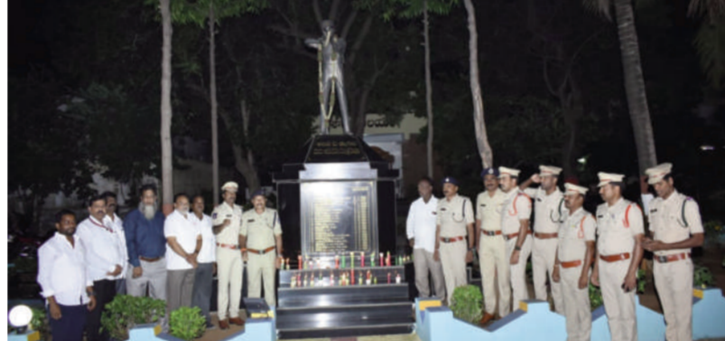
తైమ్స్ ఆఫ్ వార్త - నిజామాబాద్ రైమ్