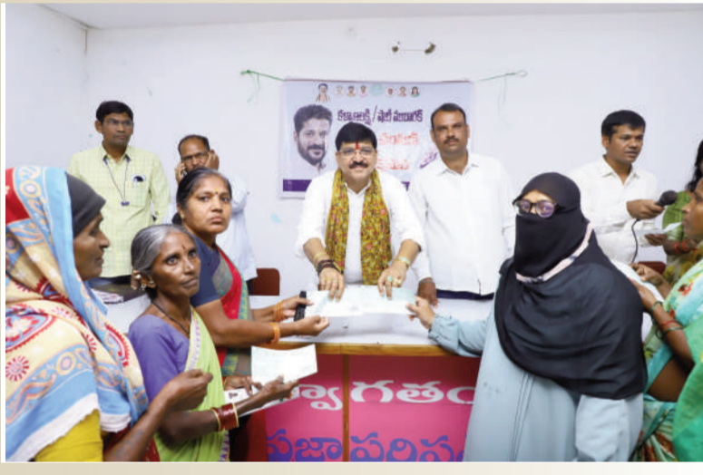
పేదల అభివృద్ధి నాలక్షం

కళ్యాణలక్ష్మి శాదిముబారక్ చెక్కుల పంపనలో ఆర్కూర్ ఎమ్మెలై