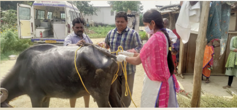
తెలంగాణ ప్రభుత్వం ప్రతిష్ఠాత్మకంగా చేపట్టిన సంచార పశువైద్యశాల

1962 సంచార పశువైద్యశాల సేవలను వినియోగించుకోవాలి