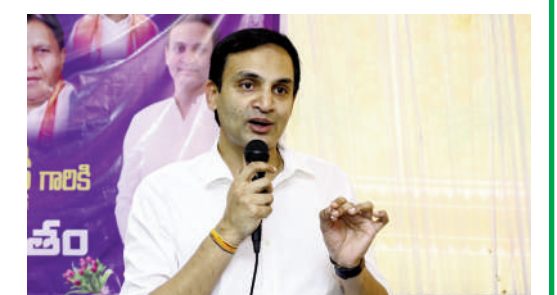
అలోచనలు చేయాలని సూచించారు.