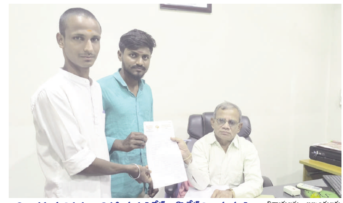
నిబంధనలకు విరుద్ధంగా నిర్వహిస్తున్న ప్రైవేట్ కార్పొరేట్ విద్యాసంస్థలపై చర్యలు తీసుకోవాలి ఏజీసీ ఆధ్వర్యంలో డీకాటి కు వినతి

టైమ్స్ ఆఫ్ వార్త - నిజామాబాద్ సిటీ బాలోత్వం పేరిట నిర్వహిస్తున్న వ్యాపార పోటీల్లోని ఉత్పన్న ధన్య కాలాపం, మూఢనమ్మకాలు అనే రెండు విషయాలను తొలగించాలని ఏజీసీ ఆధ్వర్యంలో జిల్లా విద్యాశాఖ అధికారికి