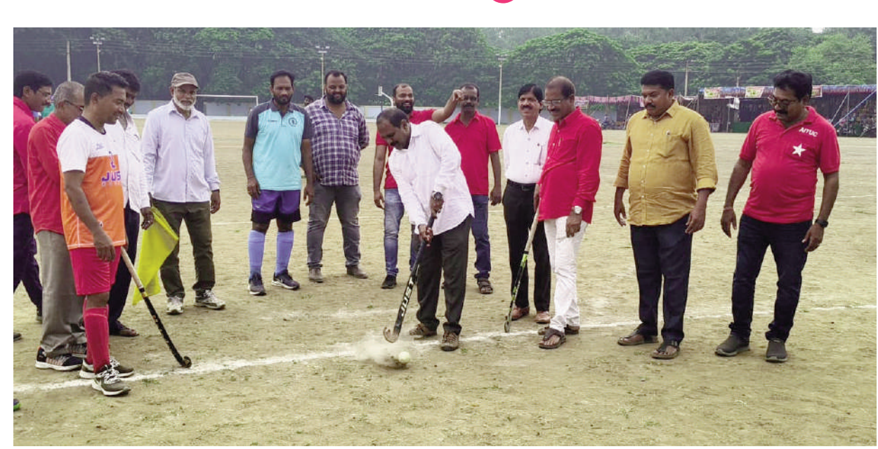
నియర్ బై ఏరియా హాకీ విజేత మందపల్లి

టైమ్స్ ఆఫ్ వార్త - మందపల్లి క్రీడలతో శారీరక దృఢత్వం మానసిక ఉల్లాసం కలుగుతుందిని అభి