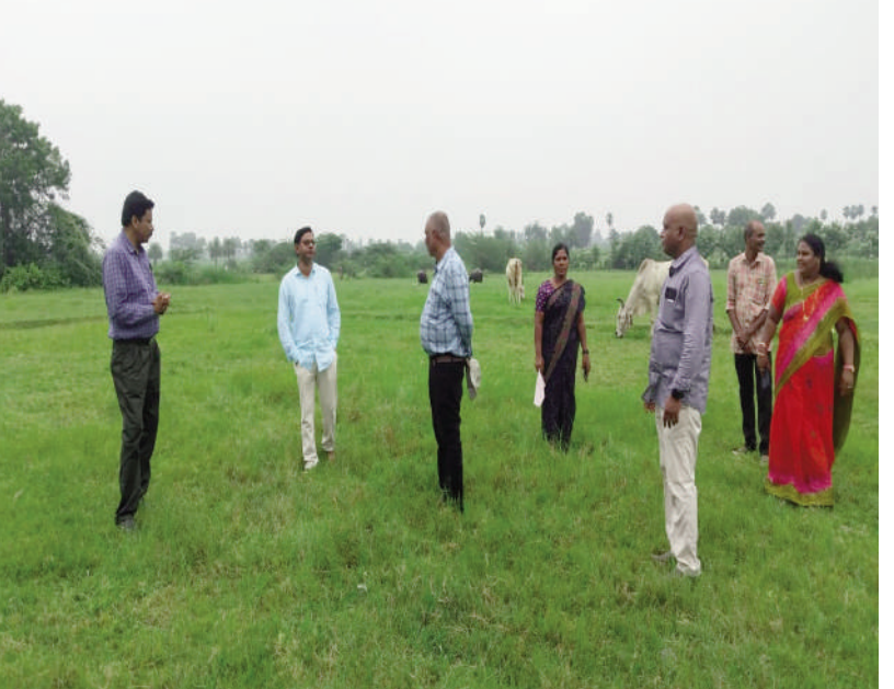
టైమ్స్ ఆఫ్ వార్త - బోనకల్