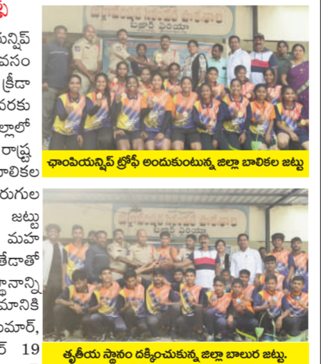
ఛాంపియన్ షిప్ టోర్నీ అందుకుంటున్న జిల్లా బాలికల జట్టు