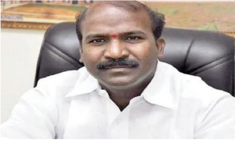
మాజీ అదనపు ఎస్పీ తిరువత్సాన్ ఫోన్ కాంటాక్ట్ ఉండటంతోనే!