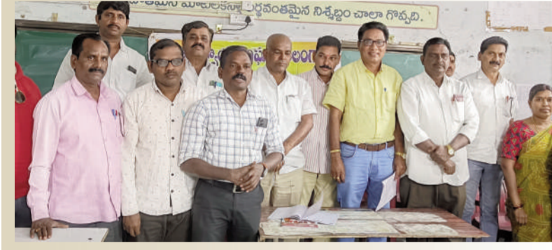
తైమ్స్ ఆఫ్ వార్త, మంచినీటి జిల్లా ప్రతినిధి:-