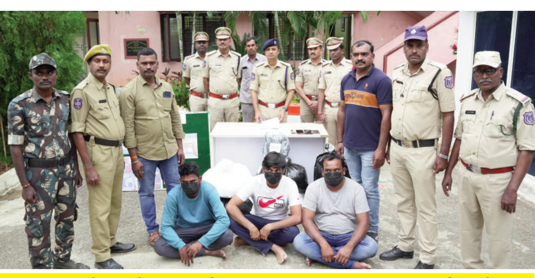
ముంబై మార్కెట్లో 100 కోట్ల విలువ కలిగిన డ్రగ్స్ ముఠాను పట్టుకున్న రాచకొండ భువనగిరి పోలీసులు