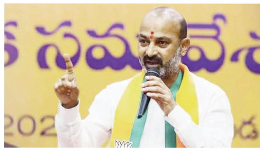
ప్రధాన కారణమని విమర్శించారు. 17 ఏళ్ల క్రితం పుస్తాలు తాకట్టు పెట్టి, అప్పు చేసి ఒక్కో జర్నలిస్టు రూ.2 లక్షల చొప్పున రూ.12 కోట్లు పోగు చేసి ప్రభుత్వానికి చెల్లించి జేఎన్ జే హోంస్ సాఫ్ట్వేరు పేరుతో స్థలాలు దక్కించుకున్నారని గుర్తు చేశారు. నాటి నుండి నేటి వరకు అధికారంలో ఉన్న బీఆర్ఎస్, కాంగ్రెస్ పార్టీలు రెండూ ఏదో ఒకసారి చూపుతూ జర్నలిస్టులకు ఇండ్ల స్థలాలు చేతికి అందించకుండా తీవ్రమైన అన్యాయం చేశాయని ఆ ప్రకటనలో వాపోయారు.

జర్నలిస్టుల హోంస్ సాఫ్ట్వేరులకు భూ కేటాయింపులు రద్దు చేస్తూ సుప్రీంకోర్టు ఇచ్చిన తీర్పు బాధాకరమని కేంద్ర హోంశాఖ సహాయ మంత్రి బండి సంజయ్ కుమార్ ఆవేదన వ్యక్తం చేశారు. అయితే ప్రభుత్వం తనకున్న విచక్షణాధికారాలను ఉపయోగించి జర్నలిస్టులకు ఇండ్ల స్థలాలు కేటాయింపులను డిమాండ్ చేశారు. అట్లాగే గత ఎన్నికల మేనిఫెస్టోలో ఇచ్చిన హామీ మేరకు రాష్ట్రంలో ఇండ్లులేని అర్హులైన జర్నలిస్టులందరికీ ఇండ్ల స్థలాలను వెంటనే మంజూరు చేయాలని ఈ విషయంలో ప్రభుత్వానికి భారతీయ జనతా పార్టీ వక్షాన పూర్తిగా సహకరించేందుకు సిద్ధం ఉందని తెలిపారు. అలాకాకుండా ఇండ్ల స్థలాల్నివ్వకుండా జర్నలిస్టులకు అన్యాయం చేస్తే బీజేపీ చూస్తూ ఊరుకునే ప్రసక్తే లేదని, జర్నలిస్టులతో కలిసి మహారాష్ట్రమానిక్ కార్యచరణ రూపొందిస్తామని తెలిపారు. అయితే జర్నలిస్టులెవరూ ఆందోళన చెందాల్సిన అవసరం లేదని, బీజేపీ అధికారంలోకి వచ్చాక హైదరాబాద్ లోని జెఎన్ జే హోంస్ సాఫ్ట్వేరు జర్నలిస్టులతోపాటు రాష్ట్రంలోని అర్హులైన విలేజరులందరికీ ఇండ్ల స్థలాలను కేటాయింపులను భరోసా ఇచ్చారు. సుప్రీంకోర్టు తీర్పుపై మంగళవారం స్పందించిన బండి సంజయ్ హైదరాబాద్ లో ఒక ప్రకటన విడుదల చేశారు. జెఎన్ జే జర్నలిస్టు హోంస్ సాఫ్ట్వేరు కేటాయింపులకు ఇండ్ల స్థలాలను రద్దు చేస్తూ సుప్రీంకోర్టు తీర్పును వెలువరించడం అత్యంత బాధాకరమని, అయితే అత్యున్నత న్యాయస్థానం వెలువరించిన తీర్పును గౌరవించాల్సిందేనని అన్నారు. అయితే జర్నలిస్టులకు ఇండ్ల స్థలాలు దక్కకపోవడానికి పడేజేపాటు అధికారంలో ఉన్న బీఆర్ఎస్ పార్టీతో పాటు ప్రస్తుత కాంగ్రెస్ పాలకులే