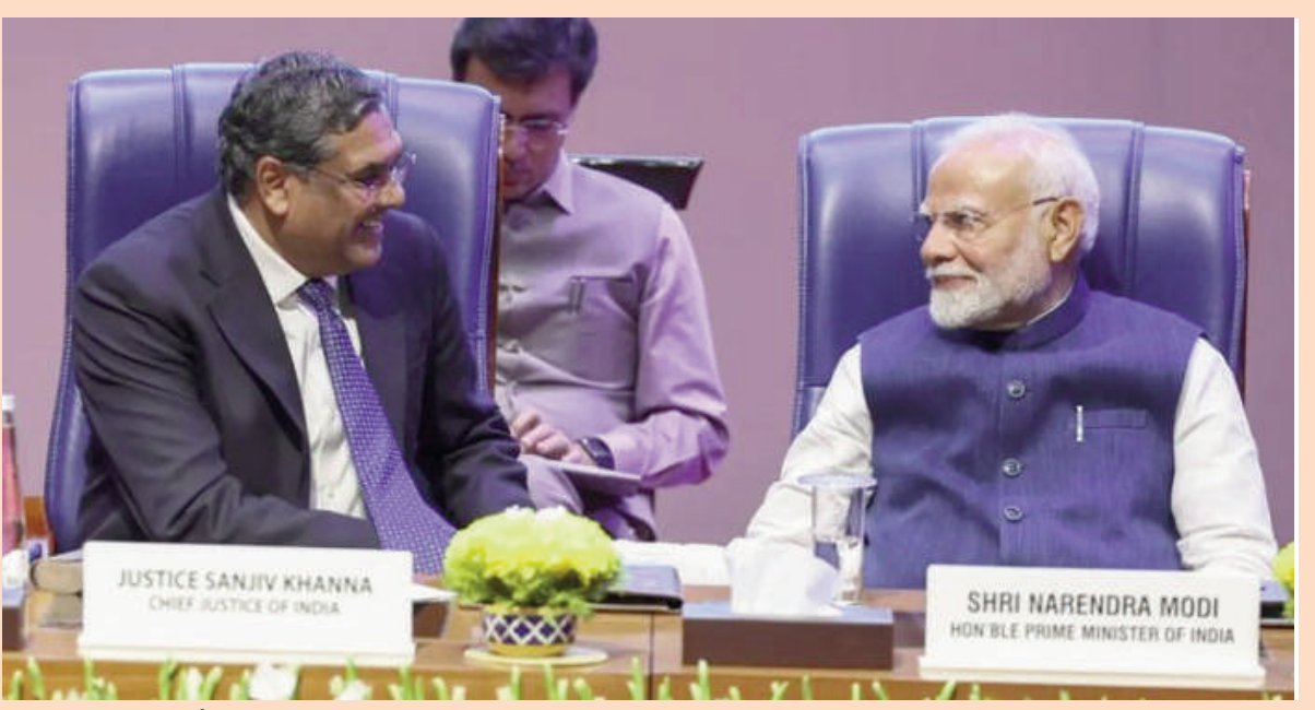
నిర్వహించినట్లు మోడీ తెలియజేశారు. 'భారత్ ఆకాంక్షలు, భారత్ రాజ్యాంగం నిర్మాతలకు తెలుసు. కలలు కాలం గడిచే కొద్దీ కొత్త వుంతలు తొక్కుతాయని మన

మ్యూంబై: ప్రధాని నరేంద్ర మోడీ మంగళవారం రాజ్యాంగాన్ని 'సజీవ ఏరు'గా శ్లాఘించారు. భారత్ పరివర్తన సమయంలో ముందుకు సాగుతున్నప్పుడు అది 'మార్గదర్శక కిరణం'గా ఉపకరించిన ప్రధాని తెలిపారు. భారత రాజ్యాంగం ప్రజాస్వామిక దీపిక అని అభివర్ణించారు. సుప్రీం కోర్టులో రాజ్యాంగం దినోత్సవం సందర్భంగా నిర్వహించిన ఒక కార్యక్రమంలో ప్రసంగించిన మోడీ ముంబయి ఉగ్ర దాడి హతలకు నివాళి అర్పించారు. దేశ భద్రతను సవాల్ చేసే ఉగ్ర మాకలు అన్నిటికీ గట్టి గుణపాఠం చెప్పాలన్న దేశం కృతనిశ్చయాన్ని ప్రధాని పునరుద్ఘాటించారు. 1949 నవంబర్ 26న రాజ్యాంగం సభలో రాజేంద్ర ప్రసాద్ ముగింపు ఉపన్యాసంలో వాడిన మాటలను మోడీ గుర్తు చేస్తూ, స్వప్రయోజనాలకు మించి దేశ ప్రయోజనాలను కాపాడు నిజాయితీ వ్యక్తుల బృందం కన్నా భారతకు ఏదీ అక్కరలేదని అన్నారు. "దేశమే ముందు" అన్న సెంటిమెంట్ రానున్న శతాబ్దాలకు రాజ్యాంగాన్ని సజీవంగా నిలుపుతుంది" అని ఆయన సూచించారు. రాజ్యాంగాన్ని ఇప్పుడు జమ్మూ కాశ్మీర్ లో అమలుపరచినట్లు, అక్కడ మొదటిసారిగా రాజ్యాంగం దినోత్సవాన్ని