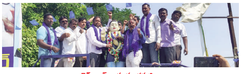
టైమ్స్ ఆఫ్ వార్త, మందవరం:-