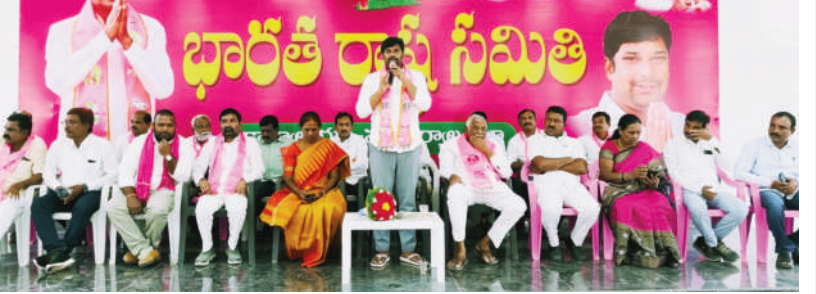
టైమ్స్ ఆఫ్ వార్త, మంచిర్యాల జిల్లా ప్రతినిధి:-