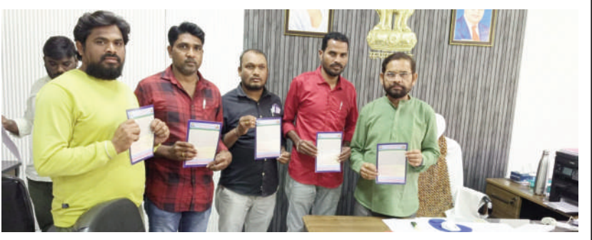
టైమ్స్ ఆఫ్ వార్త, మంచిర్యాల జిల్లా ప్రతినిధి:-

మహాసభల కరవత్రాలను విడుదల చేసిన జిల్లా అదనపు కలెక్టర్