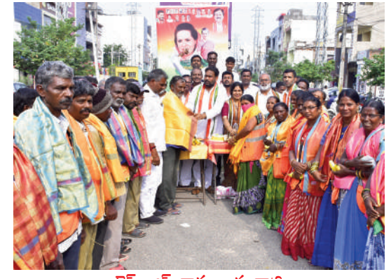
టైమ్స్ ఆఫ్ వార్త - యాదాద్రి