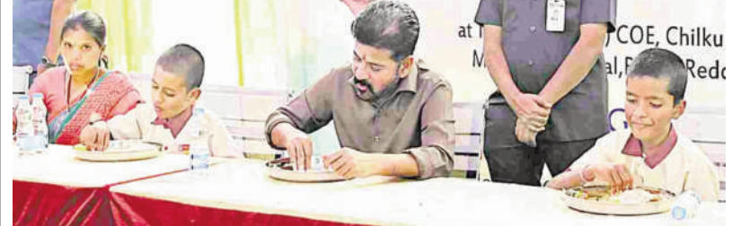
టైమ్స్ ఆఫ్ వార్త - హైదరాబాద్ :

సంక్షేమ పాఠశాలల ప్రమాణాలు పెంచడమే లక్ష్యంగా ప్రభుత్వం పనిచేస్తోందని సీఎం రేవంత్ రెడ్డి అన్నారు. తెలంగాణ పునర్నిర్మాణంలో సాంఘిక సంక్షేమ హాస్టల్స్లో చదువుతున్న వారిని భాగస్వాములుగా, భవిష్యత్ తరాలను నిర్మించడానికి పెద్దతున్న పెట్టుబడిగా మాత్రమే ప్రభుత్వం భావిస్తోంది. ఈ సందర్భంగా సీఎం రేవంత్ రెడ్డి మాట్లాడుతూ, ప్రభుత్వ పాఠశాలల్లో చదివే పిల్లలకు గ్రీన్ చానల్ ద్వారా నిధులు చెల్లించేలా నిర్ణయం తీసుకున్నామని సీఎం రేవంత్ రెడ్డి చెప్పారు. రంగారెడ్డి జిల్లా చేవెళ్ల నియోజకవర్గం మొయినాబాద్ మండలంలోని చిలుకూరు సోషల్ వెల్ఫేర్ రెసిడెన్షియల్ స్కూల్లో శనివారం 'కామన్ డైట్'ను సీఎం ప్రారంభించారు. పిల్లలతో కలిసి భోజనం చేశారు.