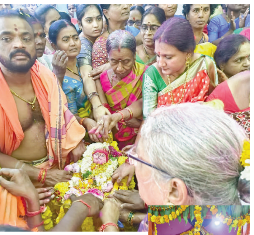
టైమ్స్ ఆఫ్ వార్త - ఎడపల్లి

ఎడపల్లి మండలంలోని రాణాకలాన్ గ్రామంలోని మాణిక్ ప్రభు మఠంలో దత్తాత్రేయ జయంతి వేడుకలను గ్రామస్థులు ఘనంగా నిర్వహించారు. గత 137 సంవత్సరాల క్రితం నిర్మించిన మఠంలో ప్రతి సంవత్సరం శార్దూమికి ఒకరోజు ముందు దత్త జయంతి నిర్వహించడం ఆనవాయితీ. 137 సంవత్సరాల క్రితం సాయిని నరసింహులు అనే వ్యక్తి మాణిక్ ప్రభు యోగిపై రచనలు, కీర్తనలు చేసి మానిక్ ప్రభు యొక్క పాదాలను గ్రామంలో ఏర్పాటు చేయడంతో అప్పటినుండి మార్గశిర మాసం శుద్ధ చతుర్దశి రోజున దత్తాత్రేయని జయంతిని గ్రామస్థులు ఘనంగా నిర్వహిస్తారు. ఈమేరకు భక్తులు దత్తాత్రేయని పల్లెకలో ఉంచి గ్రామంలో ఊరేగించి పల్లెకి సీమ నిర్వహించారు. అనంతరం మఠంలో ఏర్పాటు చేసిన నామకరణ మహోత్సవంలో దత్తాత్రేయన్ని ఉయ్యాలలో పడుకోబెట్టి నామకరణ మహోత్సవం నిర్వహించారు. అయితే సంతానం కలగని మహిళలు దత్తాత్రేయన్ని ఒళ్ళో ఉంచుకుంటే సంతానం ప్రాప్తిస్తుందని భక్తుల ప్రగాఢ నమ్మకం. దీంతో సంతానం లేని దంపతులు దత్తాత్రేయన్ని ప్రతిమను ఒళ్ళో పెట్టుకొని సంతానం ప్రాప్తించాలని మొక్కులు మొక్కుకున్నారు. అలాగే చుట్టుప్రక్కల గ్రామాల నుండి వచ్చిన భక్తులు మఠంలో ప్రత్యేక పూజలు నిర్వహించారు. అనంతరం అన్నదాన కార్యక్రమం నిర్వహించారు. గత నాలుగు రోజుల క్రితం ప్రారంభమైన గీతా యజ్ఞం నేటితో పూర్తికానుండగా నేడు ముగింపు యజ్ఞ కార్యక్రమాలు నిర్వహించిన గ్రామస్థులు తెలిపారు. ఈ కార్యక్రమానికి భక్తులు అధిక సంఖ్యలో హాజరుకావాలని వారు కోరారు. ఈ కార్యక్రమంలో మాజీ సర్పంచ్ భాస్కర్ రెడ్డి, సూరకిరణ్, గ్రామస్థులు, యువకులు, మహిళలు అధిక సంఖ్యలో పాల్గొన్నారు.