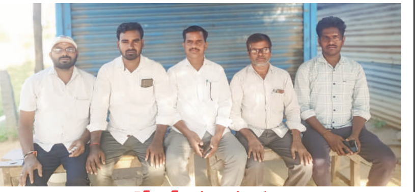
టైమ్స్ ఆఫ్ వార్త - బాన్సువాడ: