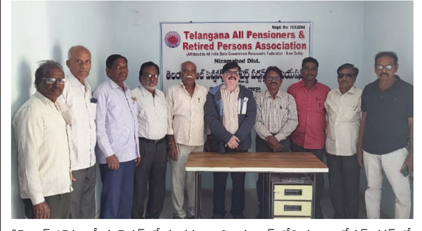
వైమ్మ ఆఫ్ వార్డు - నిజామాబాద్ సీట్