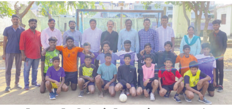
వైమ్మ ఆఫ్ వార్డు - నిజామాబాద్ స్పోర్ట్స్