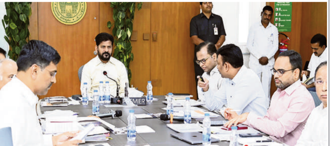
నగరానికి మూడు వైపులా ఇసుక స్టాక్ పాయింట్లు

ఇసుకతో పాటు ఇతర ఖనిజాల అక్రమ తవ్వకాలు, అక్రమ సరఫరాపై ఉక్కుపాదం మోపాలని ముఖ్యమంత్రి రేవంత్ రెడ్డి ఆధికారులను ఆదేశించారు. కఠిన చర్యలతోనే అక్రమాలను అడ్డుకోవాలని, ప్రభుత్వ ఆదాయాన్ని పెంచాలని సీఎం సూచించారు. గనుల శాఖపై ముఖ్యమంత్రి రేవంత్ రెడ్డి శనివారం సమీక్ష నిర్వహించారు. నెల రోజులు గా తీసుకున్న చర్యలతో ఇసుక అక్రమ రవాణా కు అడ్డుకట్ట వడిన విధానాన్ని, పెరిగిన ఆదాయాన్ని ఆధికారులు సీఎం కు వివరించారు. ఈ సందర్భంగా ఇసుక రీవల్ తవ్వకాలు, రవాణా, వినియోగదారులకు తక్కువ ధరకు ఇసుక సరఫరాపై ఆధికారులకు ముఖ్యమంత్రి పలు సూచనలు చేశారు. ప్రభుత్వంలోని నీటి పారుదల, ఆర్ అండ్ టి, పంచాయతీ రాజ్ తో పాటు వివిధ శాఖల అధ్యక్షులతో చేపట్టే పనులకు టీజీఎండిసీ నుంచే ఇసుక సరఫరా చేసేలా చూడాలని సీఎం రేవంత్ రెడ్డి సూచించారు. పెద్ద మొత్తంలో నిర్మాణాలు చేపట్టే నిర్మాణ రంగ సంస్థలకు అవసరమైన ఇసుకను టీజీఎండిసీ ద్వారానే సరఫరా చేయాలని సీఎం ఆదేశించారు.