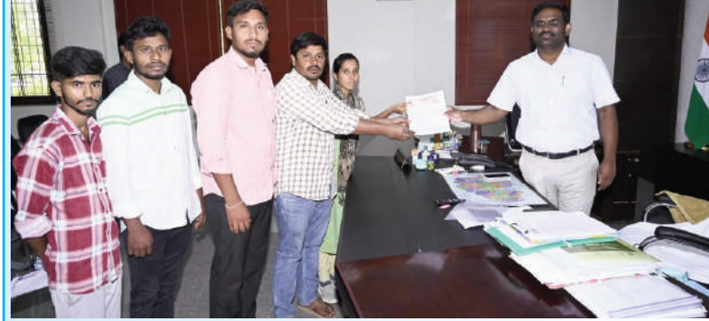
టైమ్స్ ఆఫ్ వార్త - నిజామాబాద్ సిటీ

జిల్లా కలెక్టర్ కు వివరణ పత్రం అందజేసిన ఏఐఎస్ఎఫ్ జిల్లా నాయకులు