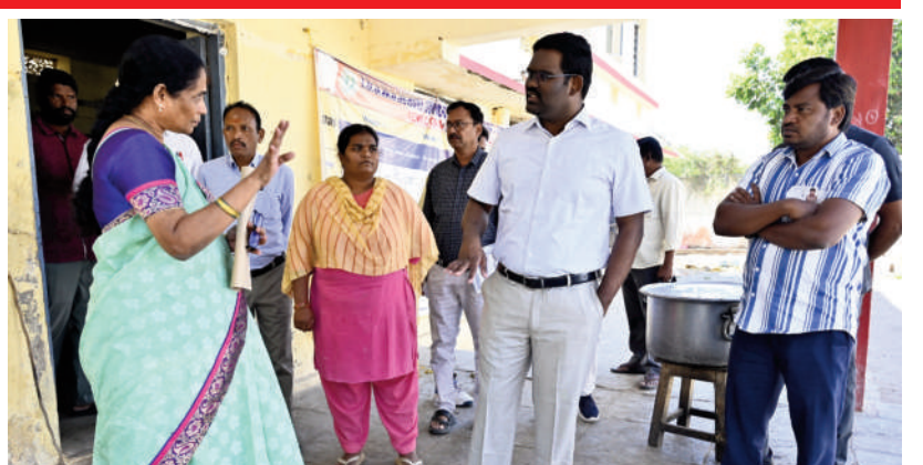
టైమ్స్ ఆఫ్ వార్త - నిజామాబాద్/డివర్సిటీ