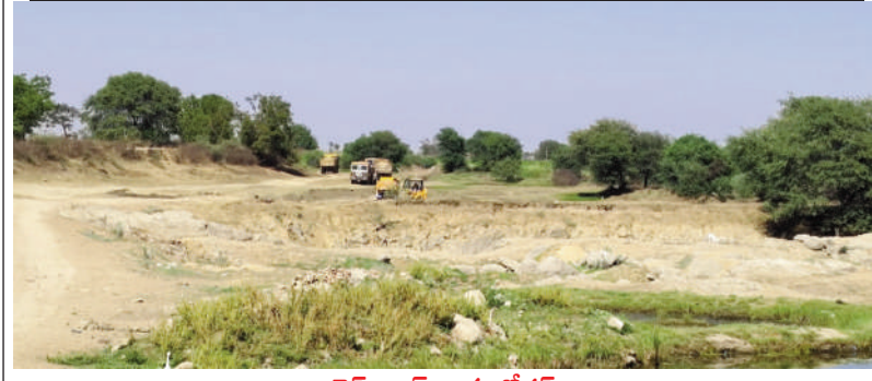
టైమ్స్ ఆఫ్ వార్త - బోధన్

బోధన్ మండలం కల్చర్ చెరువు గ్రామ శివారు బోధన్ చెరువులో మొరం తవ్వకాలు జోరుగా సాగుతున్నాయి. చెరువులు కుంటలలో చేపట్టకూడదనే నిబంధనలు ఉన్నప్పటికీ జిసి బిలతో క్రమపద్ధతి లేకుండా తవ్వకాలు చేపడుతున్నారు. ఈ విషయమై నీటిపారుదల శాఖ రెవెన్యూ అధికారులకు సమాచారం సందించడం లేదని స్థానికులు ఆవేదన వ్యక్తం చేస్తున్నారు.