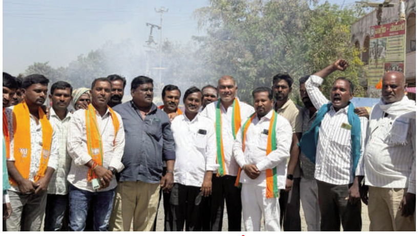
టైమ్స్ ఆఫ్ వార్త - బోధన్