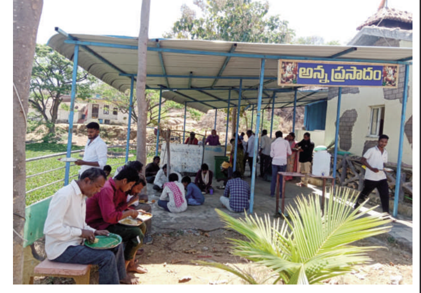
టైమ్స్ ఆఫ్ వార్త - బాస్సువాడ: