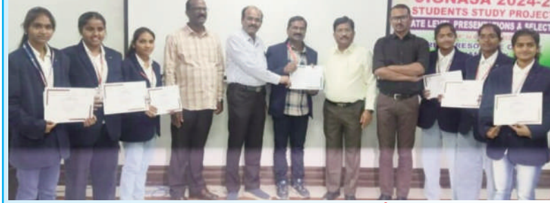
టైమ్స్ ఆఫ్ వార్త - నిజామాబాద్ సిటీ