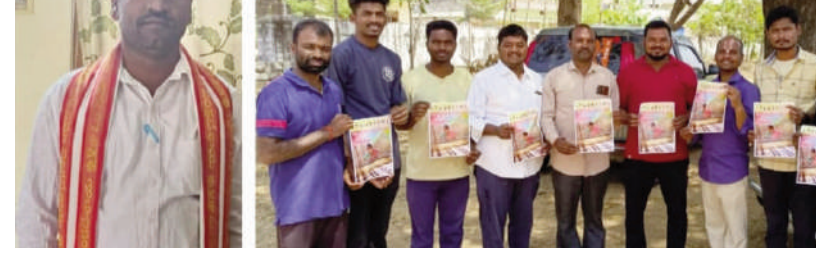
టైమ్స్ ఆఫ్ వార్త - సంస్థాన్ నారాయణపురం

రాష్ట్ర ఆర్గనైజింగ్ సెక్టరల్ సామల భాస్కర్