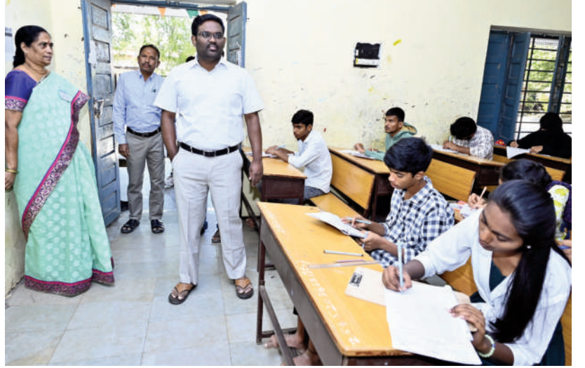
టైమ్స్ ఆఫ్ వార్త - నిజామాబాద్ జిల్లా ప్రసిద్ధి